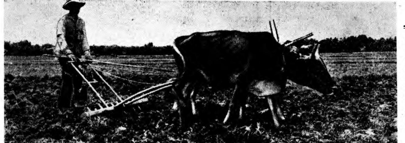
Таиланд, Тарлалангай газар элдүүлжэ ябана.