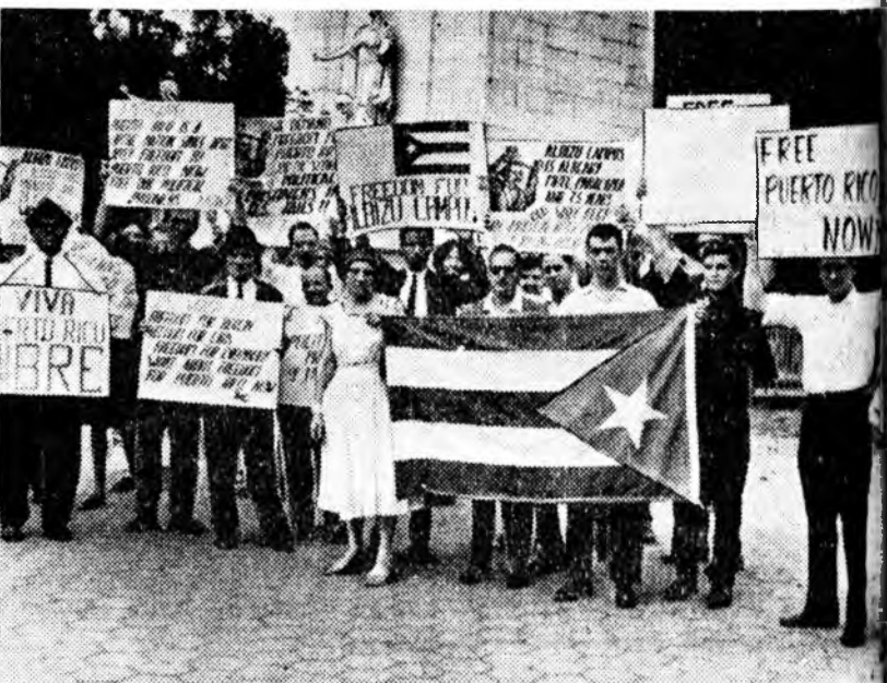
Пуэрто-Рикын хүн зон оройнгоо США-гай мэдэлдэ ороо ябадалые буруушаана. Зураг дээрэ: жагсаалда хабаадагшад пла-кадуудые баряд ябана.

Гэбшье хүдэлмэришэн ангийн нэгэдэлэй дайсан харша этгээдүүд наагаага амарагүй. Тэдэнаад 1962 оной январьда шэнэ конференци зарлажа, Африкын профсоюзудай конференци байгуулабди гэжэ хашхаралдаа бадала. «Африка Тудай» гэжэ журнал тэдэн тухай нигэжэ бэшэ нан: «Дакарада болонон профкон-ференци политическэ зорилготой-гоор, тодорхойлоот, Бүхэафрикын профсоюзудай федеративтай тэмсэл хэжэ зорилготойгоор болонон сугалан гэшэ». Түүрүүнэй үедэ шэнэ профцентрай хүтэлбэрилэгшэд «сүлөөтэ» профсоюзудай тухиралтаар коммунизмад эсэргүү пропаганда аюулаха эхилэн байгаа. Тэдэ удангүй хойлалта бо-ло, зарим хүтэлбэрилэгшэд шэнэ профцентрайэ намнадаа.