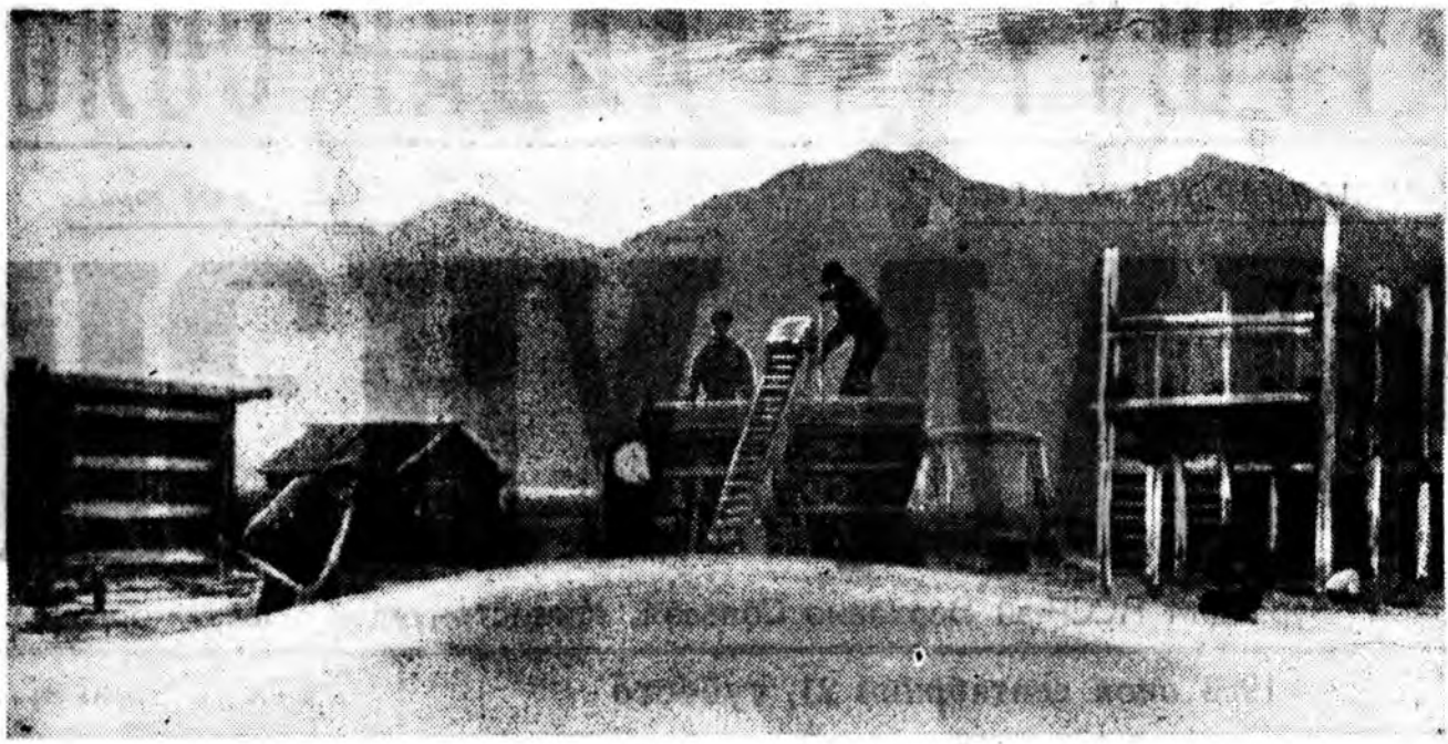
Тариа сээрлэх, тэрэнне гүрндэ тушааха, үрэнхэд хааха хүдэлмэри үдэрнөө үдэртэ үргэдэнэ. XXII партсэздэн нэрэмжэтэ колхозой гол түлээ Хилганын тоог дээрэнх гүрндэ тарьян тушаагдана. Тариа худалдаха социалис уялгяа энэ колхоз үглөө мүнөө дүүргэхээ байна. Зураг дээр: Хилганын тоог харуулагдана. (Баргажан).