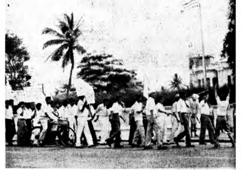
Урда Вьетнамай ард зоние хашажа, харшалжа ба эсэргүүсэһэн залуушуулай жагсаал Коломбодо США-гай Цен. посольствын байшангай хажууда болобо. Эдэ аашанууд америдай тууламжаар хэгдэжэ байгаа юм. Зураг дээр: США-гай лондонь посольствын байшангай хажуудахыг жагсаал харуулай ТАСС-ай фотохронь

алдарта ой тухай статьянууд болон материалуудыг Болгарийн хэблэл толило. Фашизмда эсэргүүгээр 1923 оной сентябрьда хэгдэн востани тууша радио болон телевидени дамжуулануудыг хэнэ.