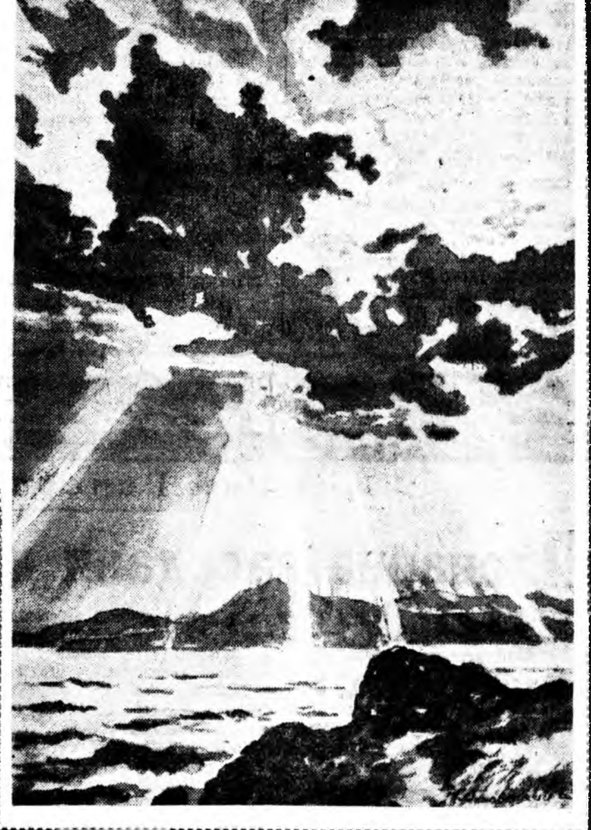
Мунөө уншагшаданга анхаралда П. Яхновецкийн һаяхан зуража дүүргэһэн хоёр зураг дуралдахманай.