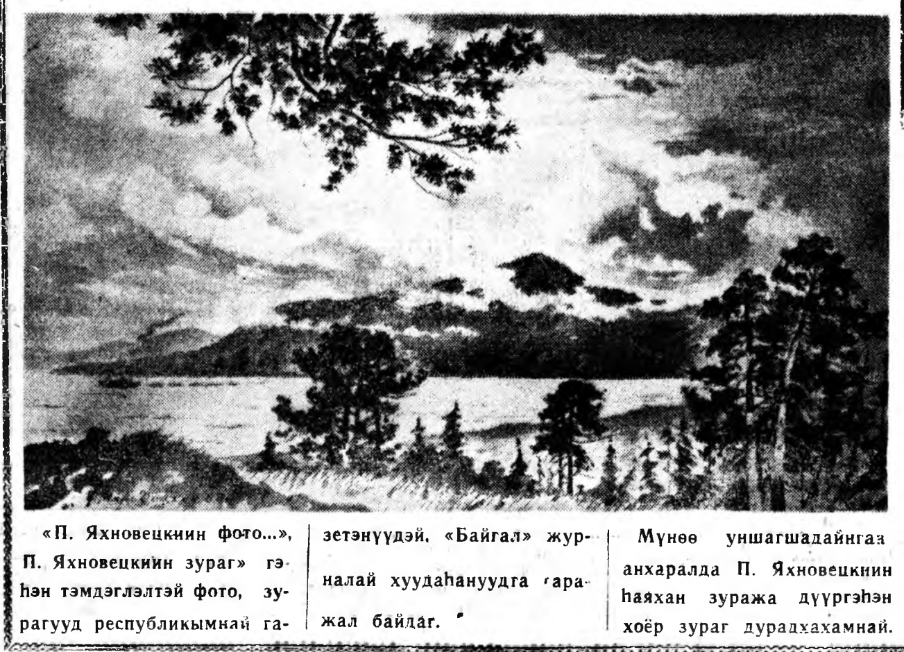
«П. Яхновецкийн фото...», зетэнүүдэй, «Байгал» журналай хуудануудга гаралжал байдаг.