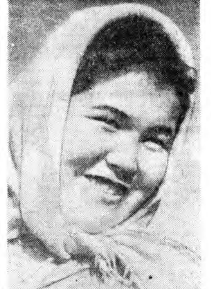
Библиотекарь өөрөөһе номууды ашаад, хээгүүр байһан ажал- шадта айналдаг заншалтай. — Мүнөө тарья хуралтын хан- туун хаһа яожа байна. Олонхи зонай хээгүүр байрладаг. Тим- мэһэ нүүдэл библиотекэ заагагүй хэрэгтэй болоо һэн. Совхозной парт-