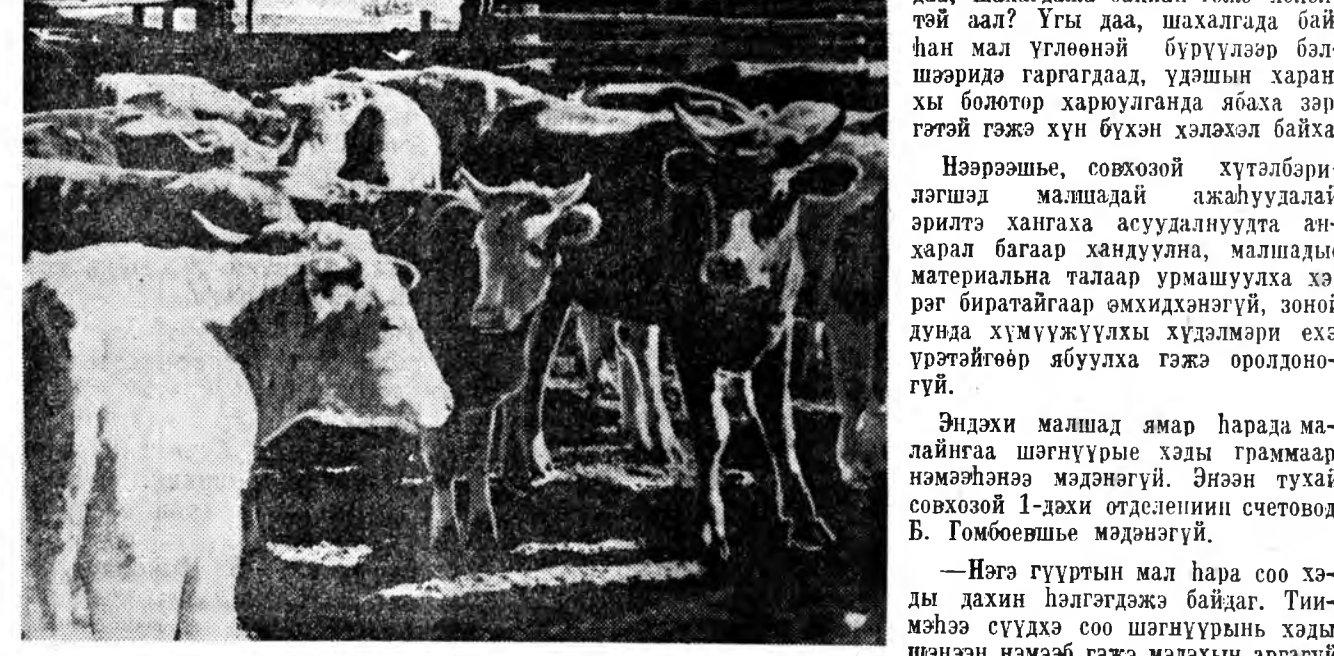
Удэрэй 11 час. Шахан таргалуулагдаха хашагар, буруунууд «хаан таргалуулагдажа» байна.

Хүдэлмэрилэгшэдые оролдосотойгоор нургаха, салин түлөөнэй талаар улам урмашуулха.