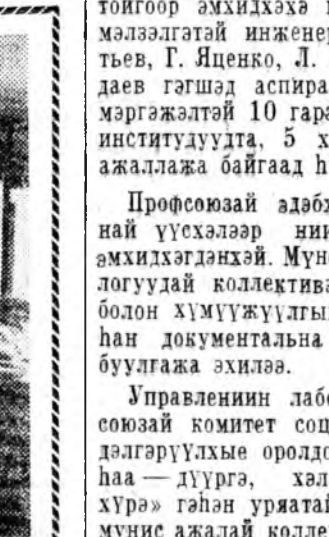
Кайто Канкавай колхозууд үдэр сонхуудууд энэ комбинатдай гурбан тоон шухала аэотино буталжүүлгэ—амниачна селитр түгээр абажа газараа үгтээжүүлнэ.