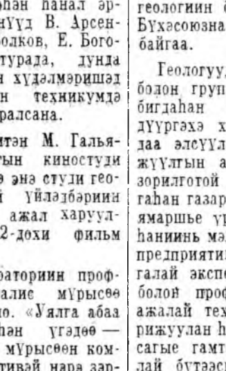
КПСС-эй ЦК-гай болон СССР-эй Министруудай Советэй бэй танилсаха зураар, тус комбинатдай химинүүд байһаа ондоо үйлдэбэриин гаргаха гэжэ шийдэбэ. Энэнь хадаа хүдөө олоо продуктуудыг элбэг дэлбэг болгохын түлөө бүгэдэ ара-шадда тэдэнэй оруулан хубита мүн.