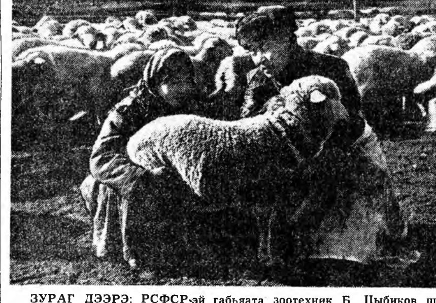
УРАГ ДЭЭРЭ: РСФСР-эй габылата зоотехник Б. Цыбков шэ-ло Зайбакалийн үүлтэрэй түгэнүүдые шалтан үзэжэ байна.

сөөн барилгашадай дунда үргэвөөр дэлгэрнэ. Гүрэнэй соведой байшантай барилгашад ерэхэ жэлэй октябрийн 7-до—ГДР-эй 15-дахи жэлэй ойдо—Болзорһоонь урид барилгынгаа хүдэлмэри дүүргэхэ гэхэн уялга абанхай.