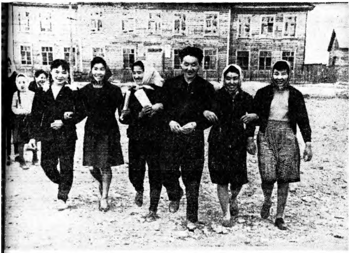
Банзаровой нэрэмжэтэ колхозой (Зэдэ) дунда хургуулиин хургагшад колхозойнгоо али бүхы хүдэлмэридэнэ туһаламжа үзүүлжэ байдаг юм. УРАГ ДЭЭРЭ: хургуулиин үхибүүд.