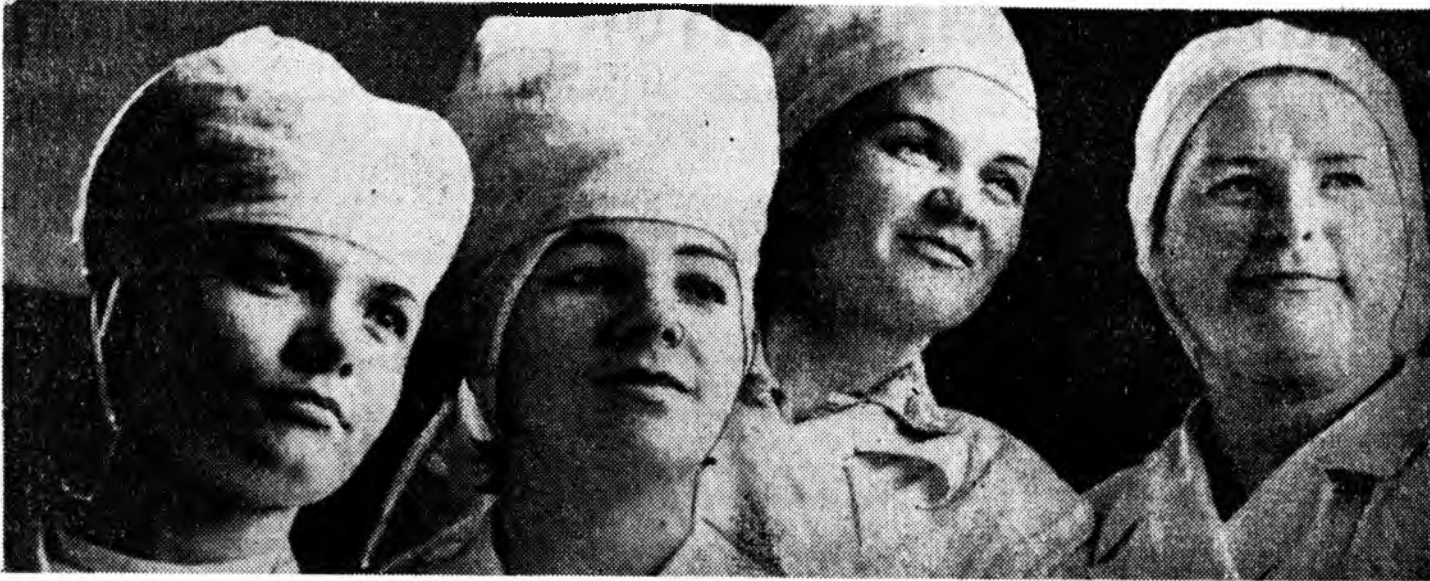
БҮХИ ОРОНУДАЙ ПРОЛЕТАРИНАР, НЭГЭДЭГТНИ