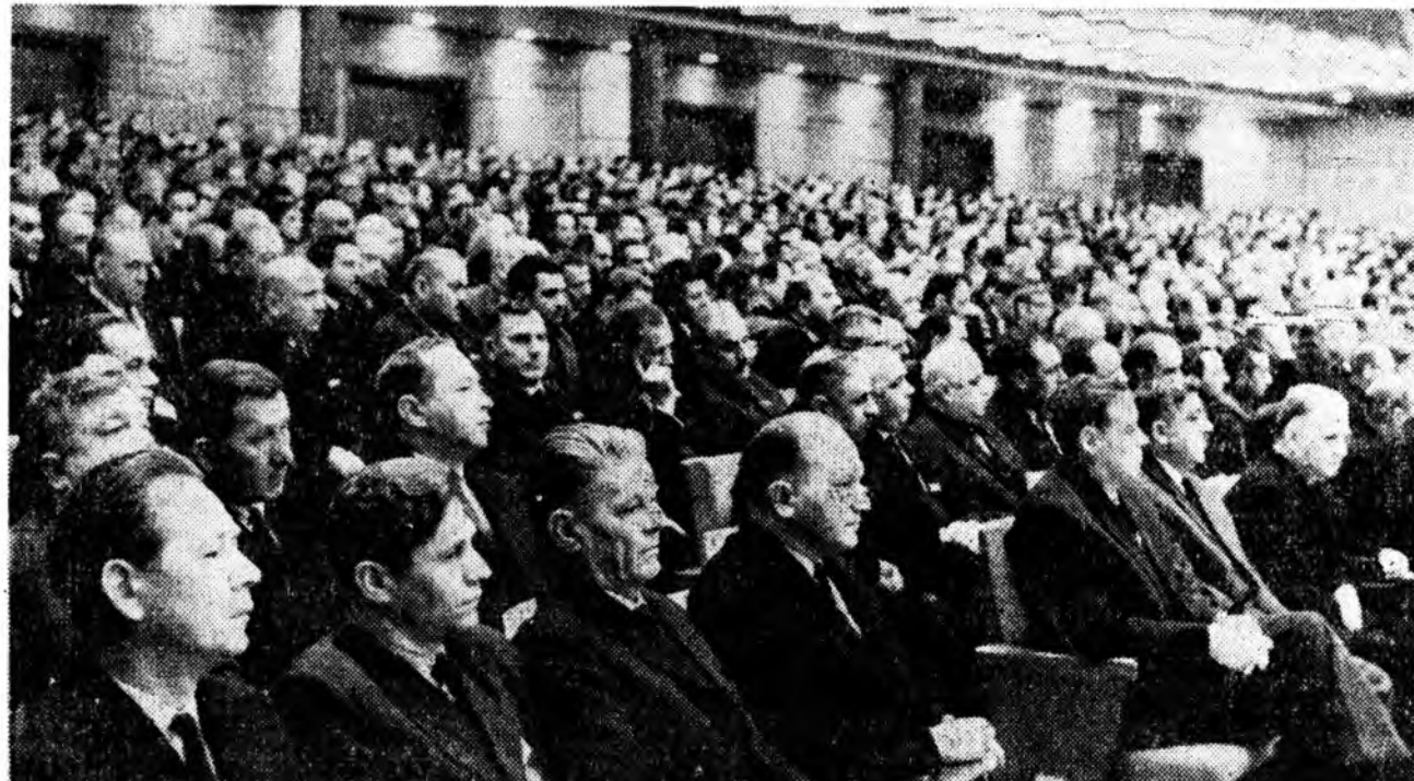
МОСКВА. КПСС-эй Центральна Комитедэй Пленум. Зураг дээрэ: заседанин зал соо.

Кабанскийн управлениин наади- шад, малшад хандан бэбэше республикынай малшад хаа ха- нагуй дэмжээхэ ёһотой. Колхоз, совхозуудай фермэ болон гурт- нуудэй наалишад ажал худалмэ- ричдөө эрбэһитэйгээр хабалдаса- жа, ажахын энэ жэлые амжалта- тайгаар дүүргэжэ, ерэхэ жэлдэ һу, мяха болон мал ажалай бусад про- дуктуудые эсхээр абахын түлөө мурысцоо эрэгтэй. Ээнтэй хам- та, хүдөө ажахые хуғжөөхэ талаар шухала хэмжээ абуулануудые харалһан КПСС-эй ЦК-гай декаб- рин Пленумэй шиндхэлбэриүүд ажалһадые шэнэ амжалтада зо- ригжуулахы дамжаггүй.