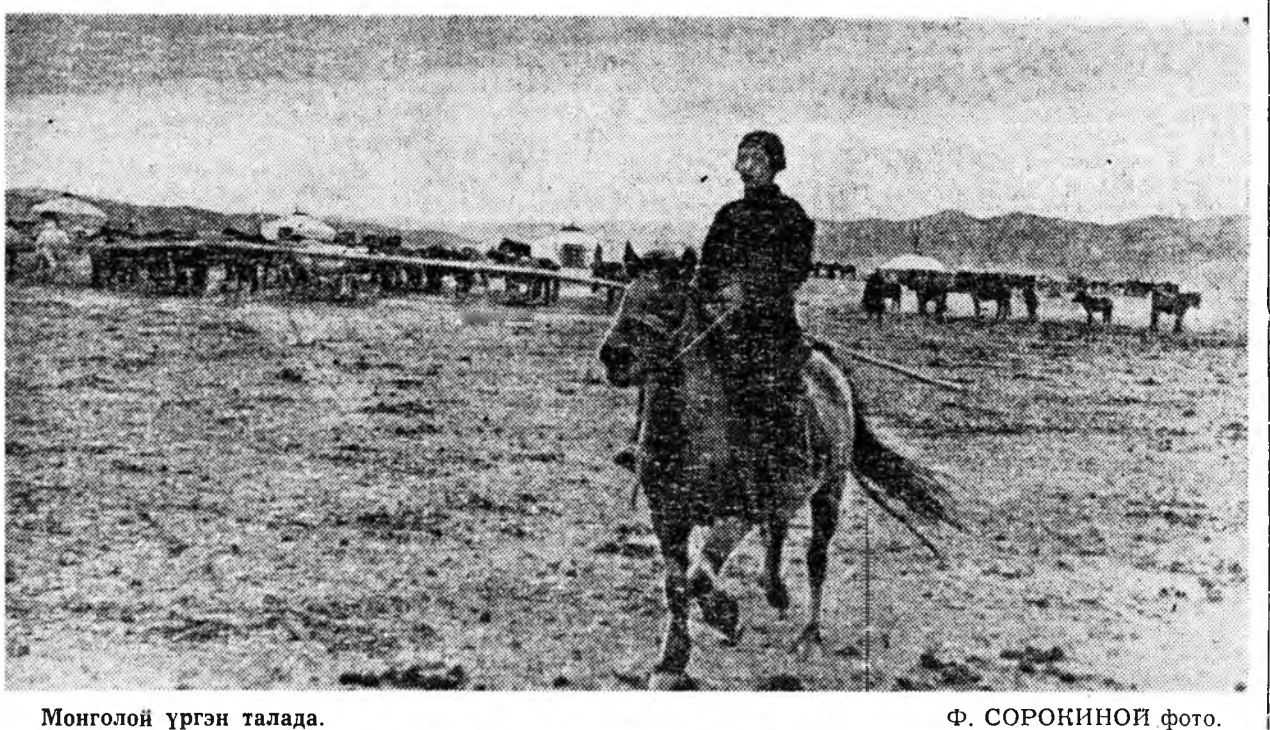
Монголой үргэн талада.

РУМЫНИИ АРАДАЙ РЕСПУБЛИКА. Бранла шадарай Кишканида орон доторхэ эгэн томо Дунайсаа цөлөөлөн комбинат баригдаха байна. Энэ комбинат Экономическа харилсан туналсалсын Советтэ ородог туралсан ороной ГДР-эй, Румынин, Польшы, Чехословакин хуөөр барилана. Тэрэнэй зарим предприятинуудын ашаглагдаа үгтэнэй. Зураг дээрэ: цехүүдэй нэгэ соо. Энэ ГДР-нээ асаргадан машинанууд.