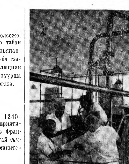
ГВИНЕИН РЕСПУБЛИКА. Гвинеин барилгашад совет мэргэжлэдтэй хамта орондоо түрүүшын консервэй заводой барилга дүүргэжэ байна. Зураг дээрэ: совет мэргэжлэтын Гвинеин худалмэришэдтэй хамта түхээрэлгэнүүдэ хабсаргана.

БЕРЛИН, январин 9. (ТАСС). Германия Нэгэдэмэл социаль партиин Баруун Берлиндэхи организаци Германия компартиин байгуулагданаар 45 жэлэй ойе баяр ёһололой оршон байдалда тэмдэглэ-