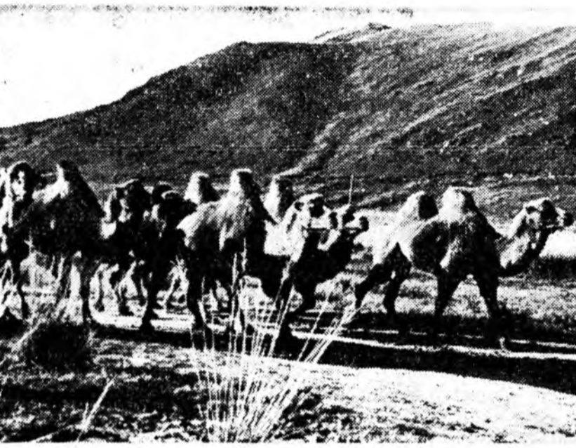
Тэмээн хүрээ—Губи нутагай омогорхол.