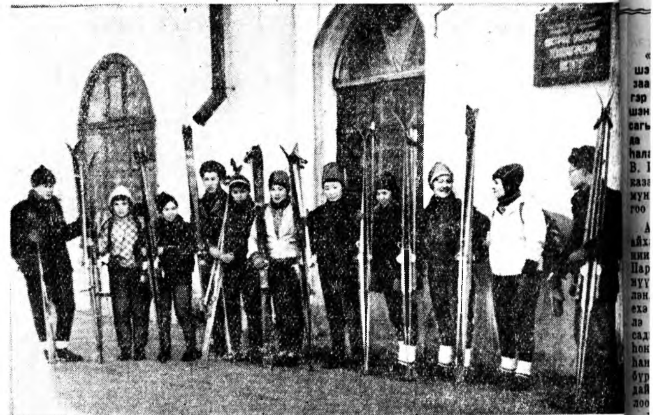
Зүүн-Сибирин технологическа институтай 4-5 дахи курсын студентэр хамта 16 хүн...