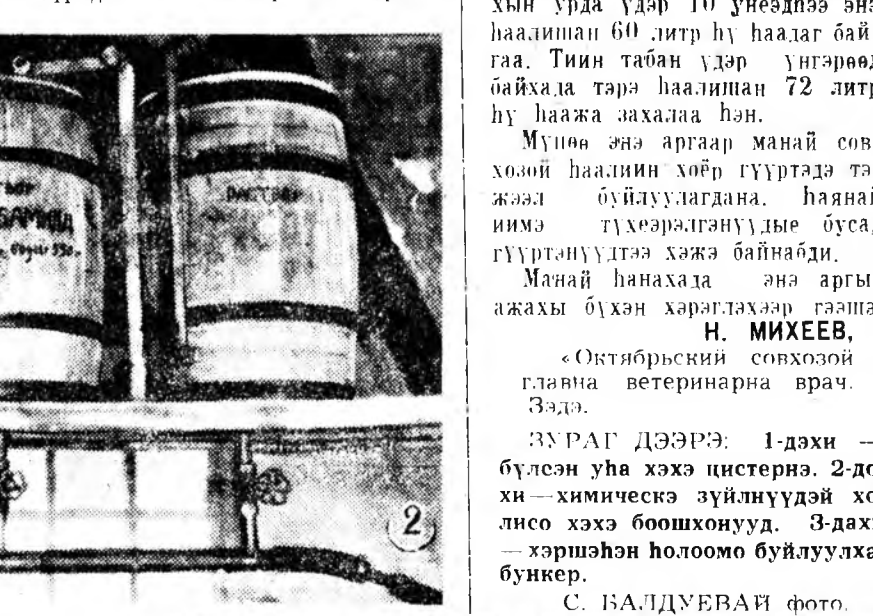
Мүнөө энэ аргаар манай совхозой хаалин хоёр гүүртэдэ тэжээл буйлуулагдана. Хаалин нимо тухээрланууды бусад гүүртэнүүдтэ хэжэ байнабди.

Нүуларын мөөрнүүд дээрэ тод-хогодон тэжээлтэй бункерээ «ДТ-20» трактораар шэрээд, малтай байра соо оруулдаг. Ингэжэ буйлуулагдан нолоомо үнэн бүридэ 5—6 килограмм хурт-хөөр үгэдэг.