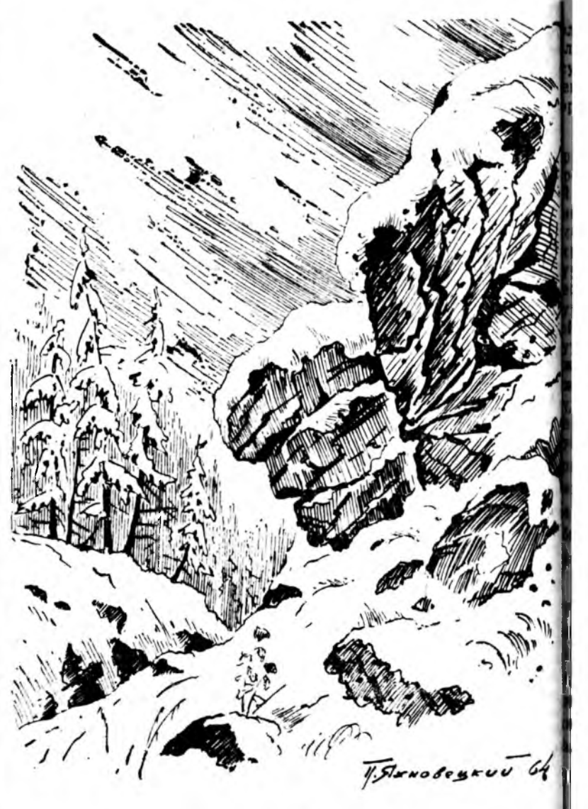
Үблэ. Сарьдаг уулын жалгада. П. Яхновецкийн зуура.

Ц. ШАГИВЕН. Хорин аймар, Нарһатын совхоз.