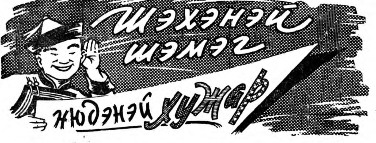
Шэхэнэй шэмэг, жудэжэй уджаар