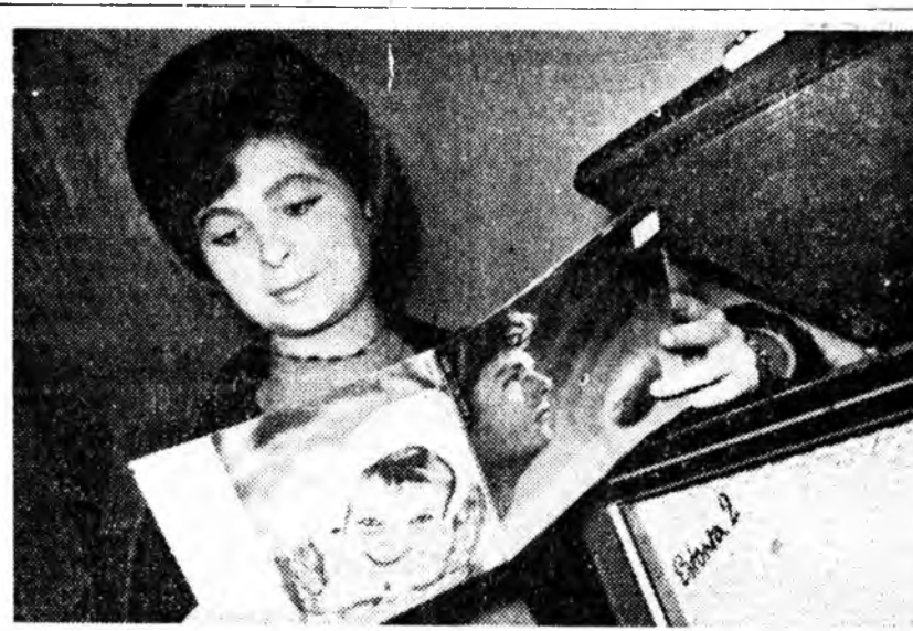
МОСКВА. Радио дамжуулгын болон телевиденин талаар СССР-эй Министруудэй Советэй Гүрэнэй комитет «Кругозор» гэжэ журнал һара бүри хэблэн гаргадаг болоһон. Энэ журнал 20 барламал хуудалтай, дуугардаг һэн энэ журналые уншаһыше. «Кругозор» гэжэ шэнэ журнал.