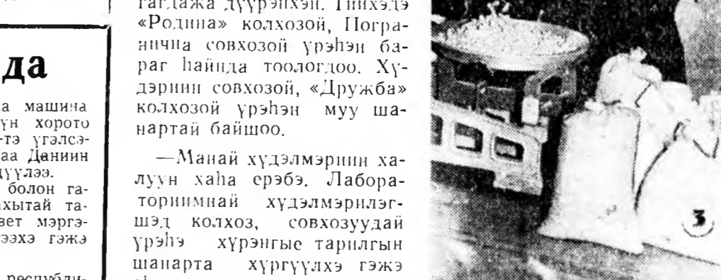
ЗУРАГ ДЭЭРЭ: 1) лабораторинэ даанга К. Шангина (зүүн гарлаа) Хяагтын совхоздо эрээд шалгахын тула үрэнэнэй ороноо абажа байна. 2) Лаборант К. Игумнова шөншын үрэнэнэй шинг шалгана. 3) лаборант А. Протасова горохой хүрэнгэ шэнгэжэ үзэнэ. С. Балдуевый фототекст.