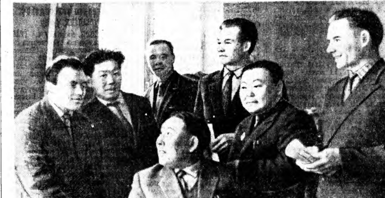
ЗУРАГ ДЭЭРЭ: КПСС-эй обкомой III пленумдэ хабаадаг шад.