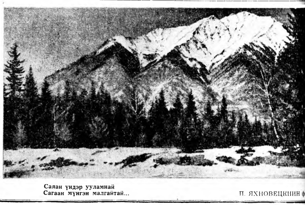
Саян үндэр ууланай Сагаан муган малгайтай...