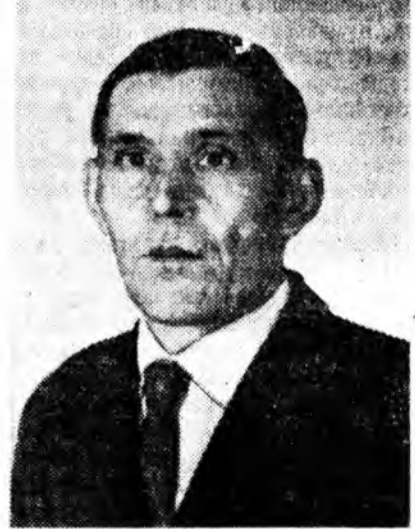
Уулбалари дору социализмда орохо зорилгатай малшадай културно-ахуйн хэрэглэмжэе хангахыа гэх уха шанартай боло...