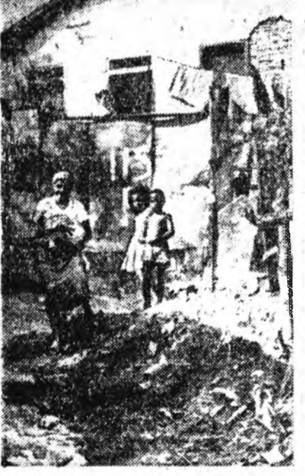
Бразилидахи байдал дэлхэйн олонинтын анхарал хандуулна. Гададын газетэ болон журналнууд ороной байдал харуулһан статья болон зурагуудые тунхаглана. «Ви Уорнер» гэжэ недели бари гарадаг хэблэлдэ абтанан энэ зураг дээрэ Рио-де-Жанейро городой захэ газарай районуудта хуудат үгтэжэшүүлэй ажабайдал харуулагдана.

Урда Аравиин хүн зондо асаргүүгээр Англиин солдадуудай хэжэ байһан дайн байлдаае элшэхэдээ, лейбористска партиин национальна гүйсэдмой гөшүүн Ян Микардо «Трибьюн» гэжэ долоон хоног бүридэ гарадаг хэблэдэе толиһон статья соого нигэжэ бэшэнэ. Англиин солдадууд Адендэ байлдаа хэжэдээ, Англиин национальна аша түбһе бэшэ, харин «нефтийн монополинуудай ашаг олоо эхээр олохо ябадалы» хамгаална.