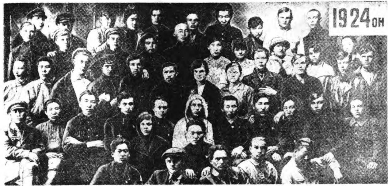
PKCM-эй Буриадай организацин түүрүүшн конференцин делегадууд.