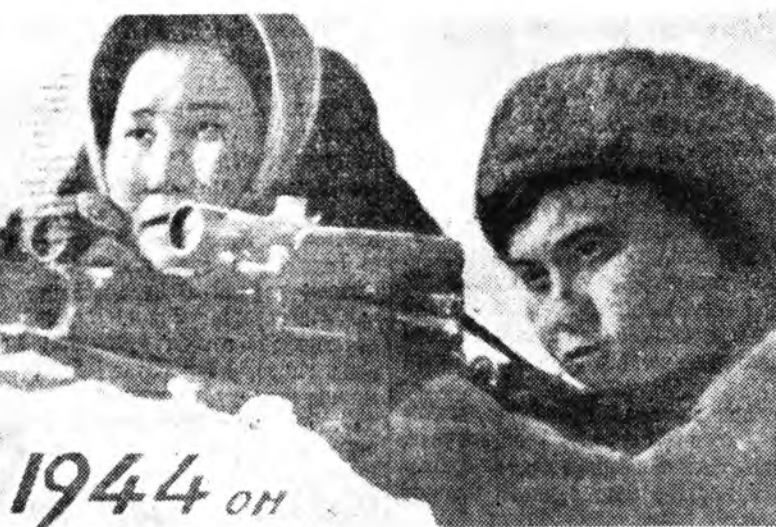
Буриадай багшанарай институтай студентнэр мэргэн буудалгын кружогто эдэбхитэйгээр хабаада.

Комсомол гэһэн совхозойнгоо хүдэтэ нэрэ улам һайнаар хурьдэ тула хуеа шадабария, эрдэм баш гамнигуй ажалладай гэжэ хүдэлмэриншидэй, бүхы малшад, ярамалшад Буриад оронойнгоо комсомол нэрээр баруулан шэнэ совхоз тогтодоһон гэжэ урлалтай гаралда манда худалда дуртайшууд Улаан-Удэ болон бусад хоту горьдуудһаа хэдэн бүлгээр ерһэн һэн. Тольбо талаа газарта түрүүшн бураада тата-