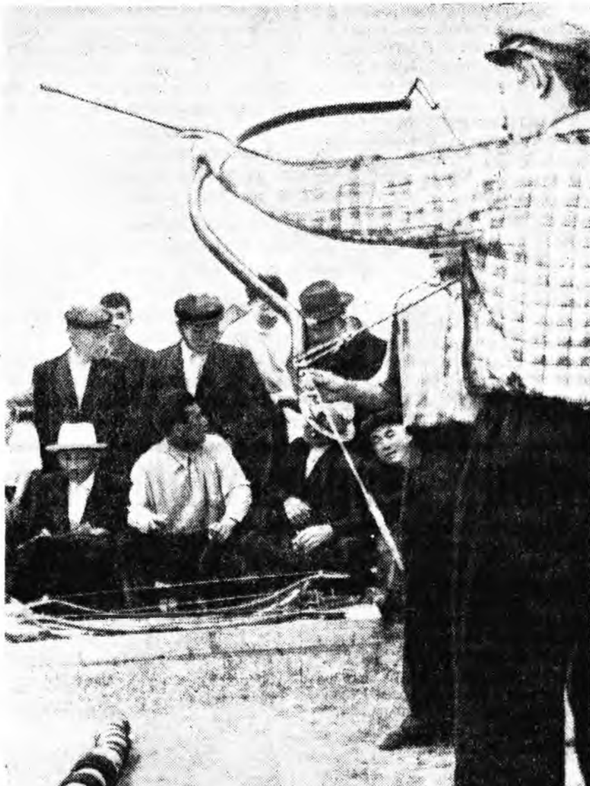
Агын буряадай национальна окрутой Зугаалайн Лениний нэрэмжит колхоздо спорт хувцэги. Энэд спортын 14 секци байгуулагдаад амжалтайгаар худалжа байдаг.