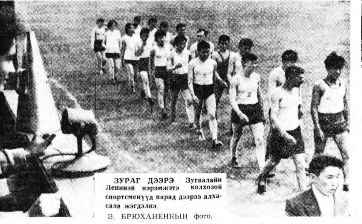
ЗУРАГ ДЭЭРЭ Зугаалайн Лениний нэрэмжит колхозой спортсменууд парад дээрээ алхасаа жэгдэнэ.