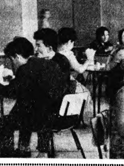
Хули соонь шүлэ, мяа шааналха, сай бусалгаха ехэ электро-тогонууд бии, электрын хүсөөр хидэмэ зүбэхөнөө эмилдэ, хөөрөгшүүдэ тодогтохой. Эдэ дэлхэртэй широжки, кофегэр, лон унда хараха, ула шаанал ха бүрэт нээгдээ.

Улаан-Удэ хотодоннай нүүдэй жалуудта гэр байра, нугуудай столонууд олоор баригдажа, ашаглалгада үгтэнэ. Найхан хүдөө ажахын институудай дэргэдэ 160 хүнэй нэгэ доро орожо хооллохо аргатай хоёр дахар столово баригдаба. Тэндэн дүрбэ мянгаал студентунар эдэлжэ аргатай болбо. Тус столоводо эдэ хоолоо электрын элшэ хүсөөр бэлдэдэг. Мун өншөөгө машинанууд тогтоходо, шагна цехүүд нээгдээ. Эмхэ индустриүүд дээшээ — хоёрдохой даохарта лифтаруу кинопо дарахада кухинда гаргагдахална. Кухин соонь шүлэ, мяа шааналха, сай бусалгаха ехэ электро-тогонууд бии, электрын хүсөөр хидэмэ зүбэхөнөө эмилдэ, хөөрөгшүүдэ тодогтохой. Эдэ дэлхэртэй широжки, кофегэр, лон унда хараха, ула шаанал ха бүрэт нээгдээ.