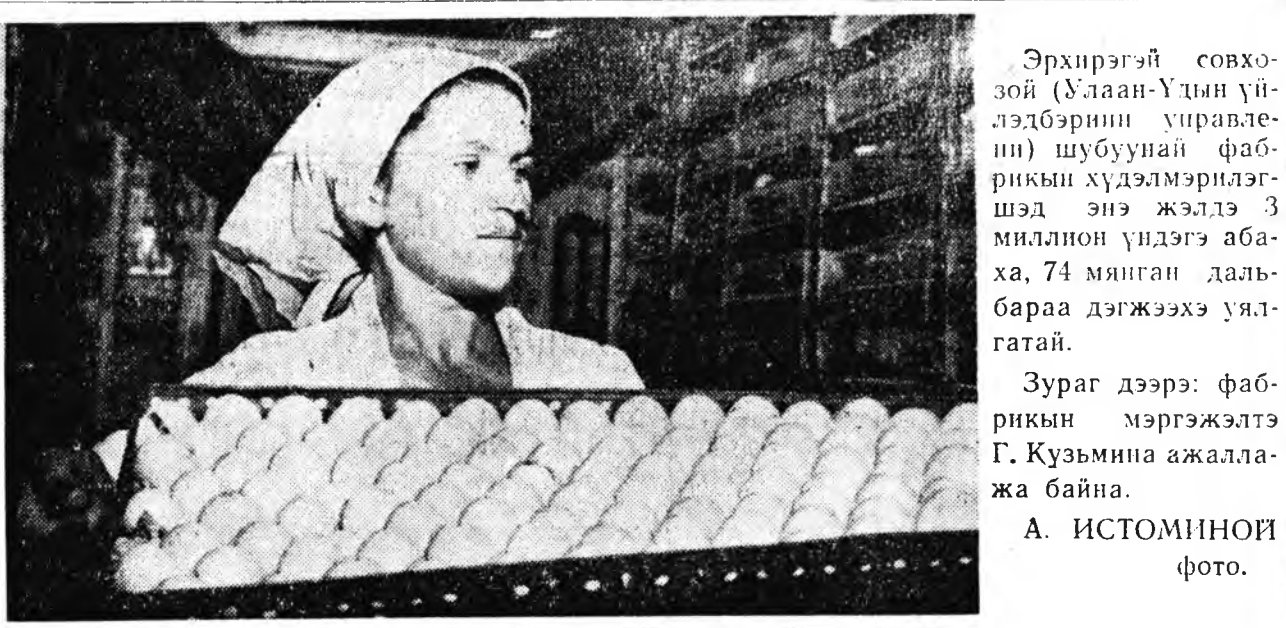
Эрхирэгэй совхо-зой (Улаан-Үдн үйлдэбэрини управ-лени) шубуушай фаб-рикийн хүдэлмэрилэг-шэд энэ жэлдэ 3 миллион үндэгэ аба-ха, 74 мянган да-баргаа дэгжээхэ үл-гатай.