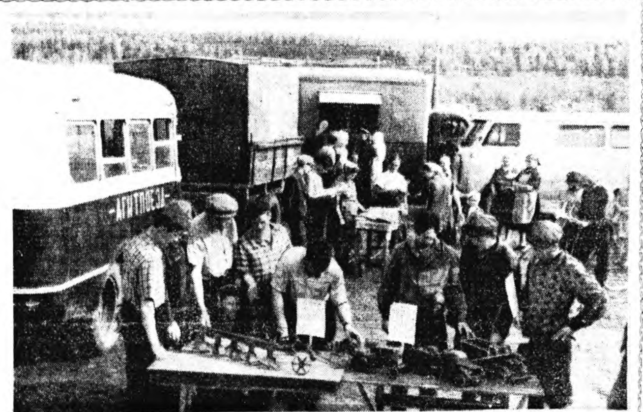
Хүдөөгэй клубуудай бүхэсоюзна харалга

АН ХИЗААР. Соронинско ... ринн управленин парком ... станууд, малай фермнүүд эгзэн холуур байдаг ... дудаар тойрон ябадаг ... байгуула. Табан авто-мо ном болон эд бараа ... лавкнүүд, хубсаа ху-дшо болон хальбэн хавша ... парикмахерска, хүн зоной ... шижэ хангаха комбинат ху-дшо байдаг юм. Мүн тэндхи ху-дшо дуршэлэй кабинет тон хо-лоой. Тинхэдэ шэнэ машина ... малай фермын болон уһан-шэ түхээрлэнүүд, элдбиһан ... тарижууланууд энде ха-дана Энээнгэ гадна, үбшн-энэ эмгэхэ поликлиника яба-д ... тээддэ ябадаг хүнүүд ... лекци хэдэг, КПСС-эй ... декабрин болон февралын ... үүдэй шидхэбэринүүдэй ... тата тухай хөөрлэдөө үнэгэр-энэ һанханай бүлгэмөөрхн ... концерты тандаг юм.