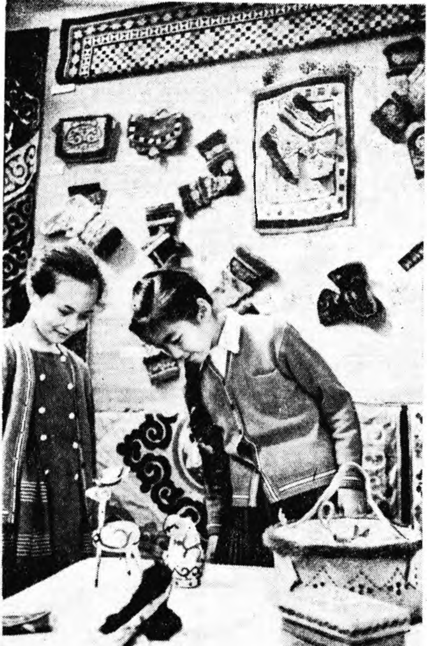
Хабаровскийн хизаар ороноо шэнжэлжэ музей соо Амар мурэн шадархи хойто зүгэй арадуудай урталгын выставкэ нээгдээ. Тэндэ гоё найхан ковернууд, дорожонууд, тэрлүүд, малгайнууд гэжэ мэтын хубсаа хунар табигданхай. Тэдэ бүгдэ оорэ нонин национальна угалзнуудаар шэмэгдэнхэй. Энээнхэ гадна, олон янзын нилэмэл хэрэгсэлүүд бии юм. Эдэ бүгдэнанайцууд, удэгэйүүд, улчууд, нивхүүд, эвеконүүд болон Амар мурэн шадар, мун Охотско далайн эрбэ тойрон буудаг үндэс ялтанай уран гараар бүтээгдээ. ЗУРАГ ДЭЭРЭ: выставкэ хаража байна.