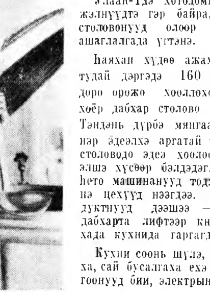
Улаан-Удэ хотодоннай нүүдэй жалуудта гэр байра, нугуудай столонууд олоор баригдажа, ашаглалгада үгтэнэ.