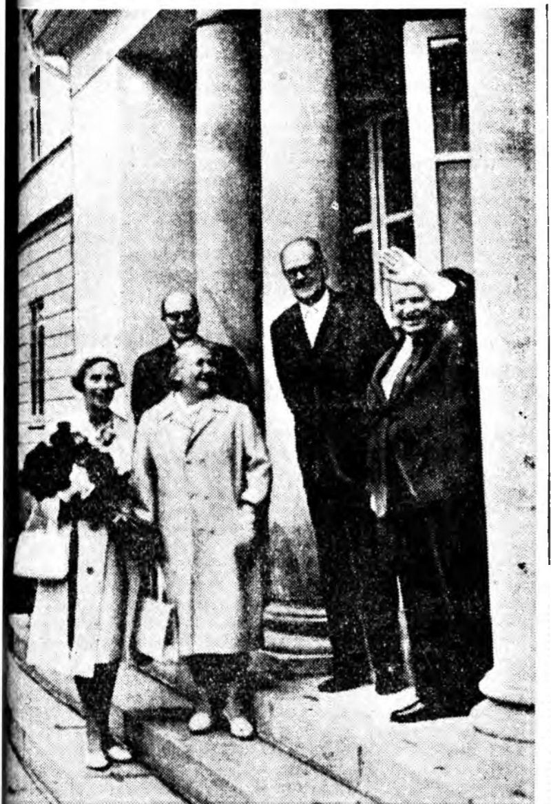
СССР-эй Министруудай Советэй Турүүлгш Н. С. Хрущев, ошолонгоо хунууд албанай хэрэгээр Швейцарид аяншалжа ябана. Урлал дээр: Н. С. Хрущев Хага ордондой дэргэдэ Стокгольмын зомаршалгада харюусажа байна.