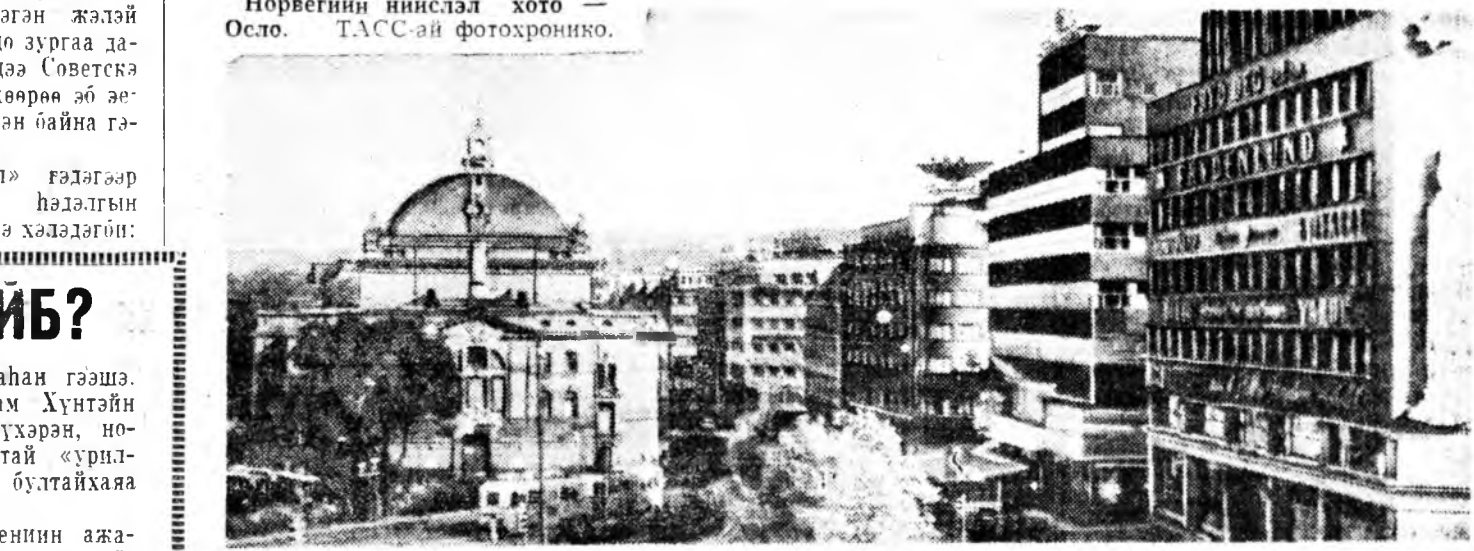
Норвегийн нинслэ хот — Осло.

«Дурна зүгһөө аюул» гэдэгээр манай зоние айтлага һалдгын гаргагдахада, би ингэжэ хэлдэгин: