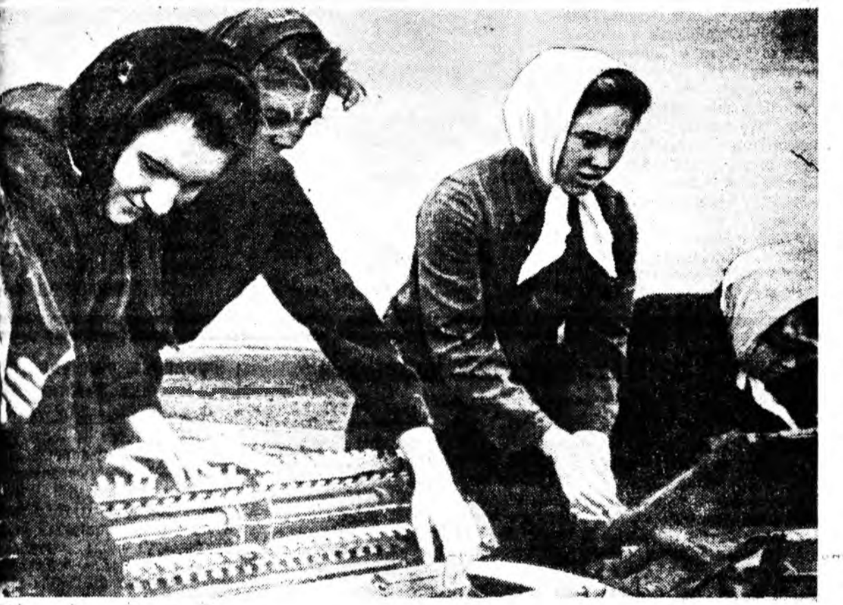
Бэшүүрэй найман жэлэй нургуулида үйлдэбэрини практикна хайнаар үнгэргэгдэнэ. Зунай амаралтын үдэе тус нургуулин хурагшад эндэхид колхозон поли дээрэ бригада болон ажалладаг юм. Зураг дээрэ: хурагшад саахарай сэккэ тардаг техниксэй танилсажа байна.