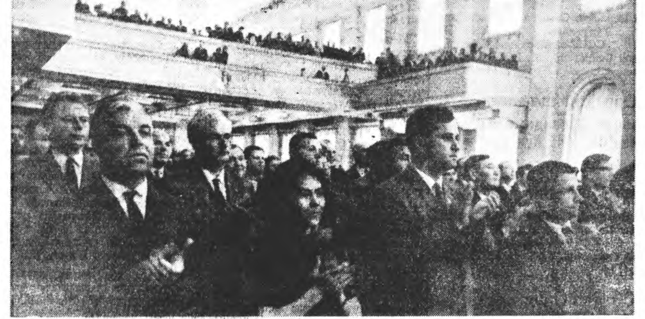
СССР-эй Верховно Советтэ IV сессин заседани дээрэ.