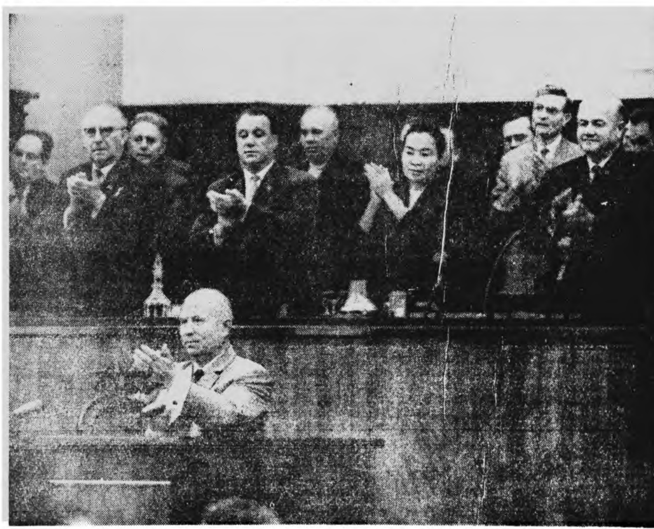
МОСКВА. СССР-эй зургаадахи зарлалай Верховно Советэй дүрбэдэхи сесси, Зураг дээрэ Н. С. Хрущев элдхэл хэжэ байна.

шүүдтэ пенсиг тогтоохо, мүн гэжээрэй, эдүүрые хамгаалгын, хүн зоние хангалда бусад зарим халбаринуудай худалдмэригшэдэй салин хульа дээшлүүлэхэ аргатай боло. Мүнөө үедэ бусад союзна республикануудай шэнги Киргизидэ үндэр