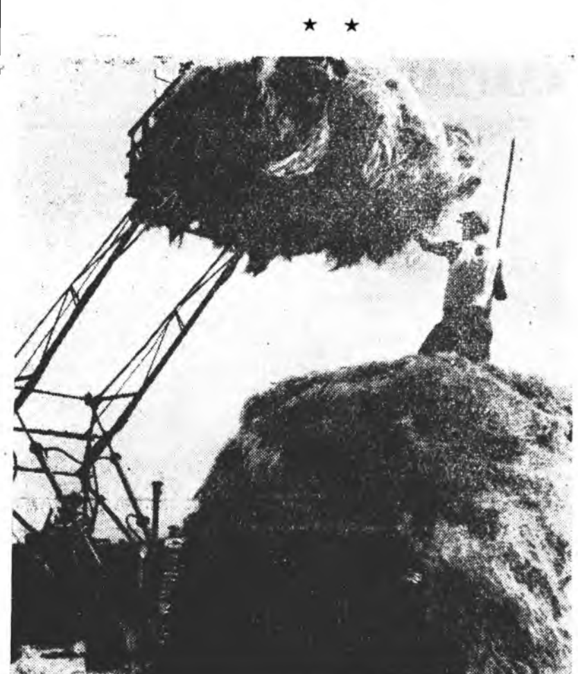
Буряадай хүдөө амахан институтай хүрлэсалай амаханхид үбнэ хурялгада жэгдэрэн ороод, ажалаа хайнаар эмхидхэмэ байна. Нүхэр Константин Загузайн хүтэлбэрилдэг оньхожоруулагдаһан звенно наадгүйгөөр ажаллажа, 300 центнер үбнэ хүрлижэ абаа. Зураг дээрэ: тус звенногыхид тармагдаһан үбнээ хүрлижэ байна.

■ Бригада, звено бүхэн агрегадуудаа бүтээсэтэйгөөр ашаглаха. ■ Бүхы хүдэлмэриг оньхожоруулаха хүсөөр бүтээхэ. ■ Силос даралгыг шамдуугаар ябуулаха.