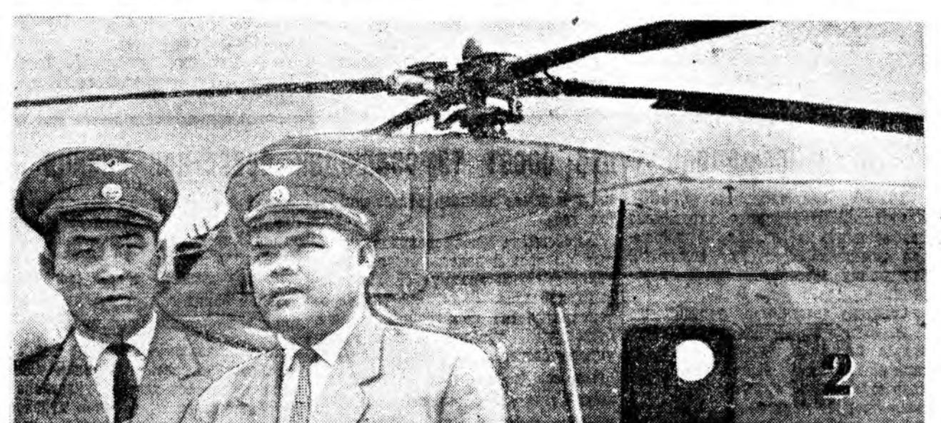
2. Улаан-Удын аэропортын вертолечигуудай дунда үндэр бүр...