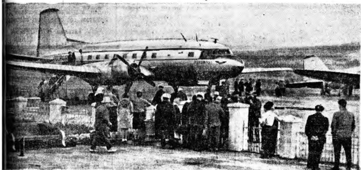
ЗУРАГУУД ДЭЭРЭ: 1. Ажалшад Эрхүү—Улаан-Удэ гэнэн маршрутдаар нийдээ «ИЛ-14» самолёдо хуужа байна.

Социалис наука, техникын, промышленностин буйх халбаринуудай туйлай совет хүгдэйд байганай ашаар да совет авиацида нима тгяхамшагта хубилалта болобо гэжэ.