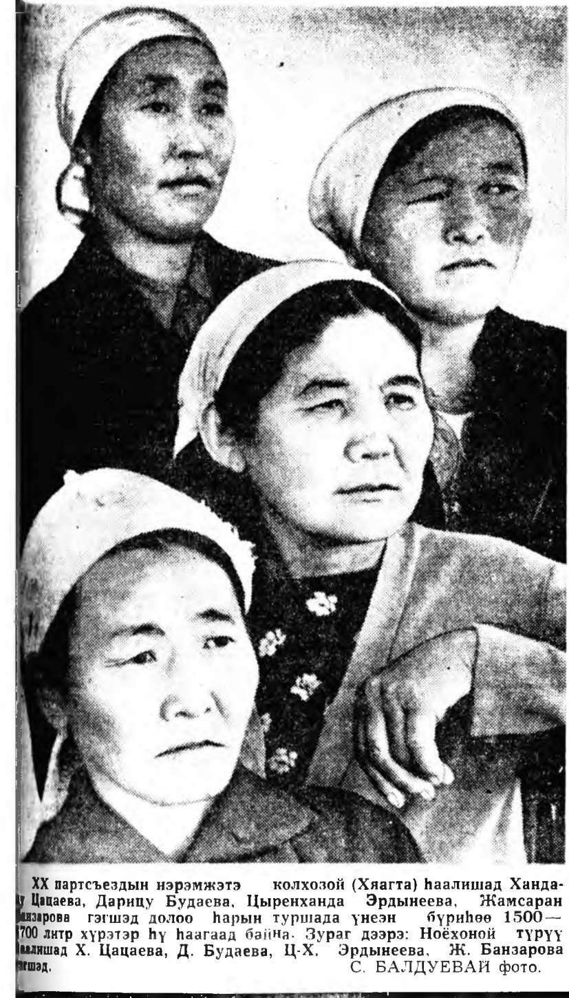
Зундаа үнэгн бүригөө 1000 килограмм хүн

Шэнэ ном „ХАЙРАНГА“ уншаад бодоходо Хайжан Бурзадай номой хаблал Лондон Ульцгевэй «Хайранга» галхан шүлэгүүдэй суглуулбары хаблган гаргаб.