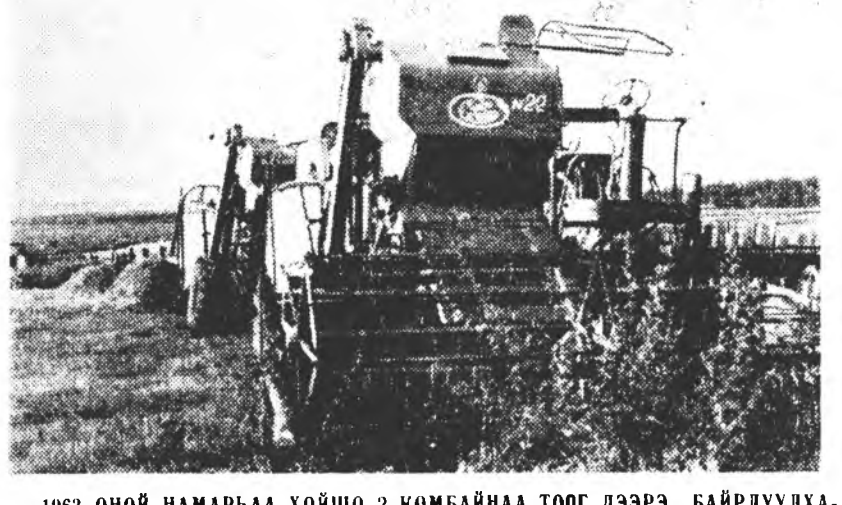
ТООГОЙНГОО БАРАБША ДОРО. ҮРМЭДЭЭН СОО БҮРИДХЭЛГҮЙ ОРООХО ХАЯАН ИСЭНГҮЙН СОВХОЗОЙ (ЯРУУНА) НӨДЭ ШЭНГҮЙ БАЙЛТАЙ АЛЛ?