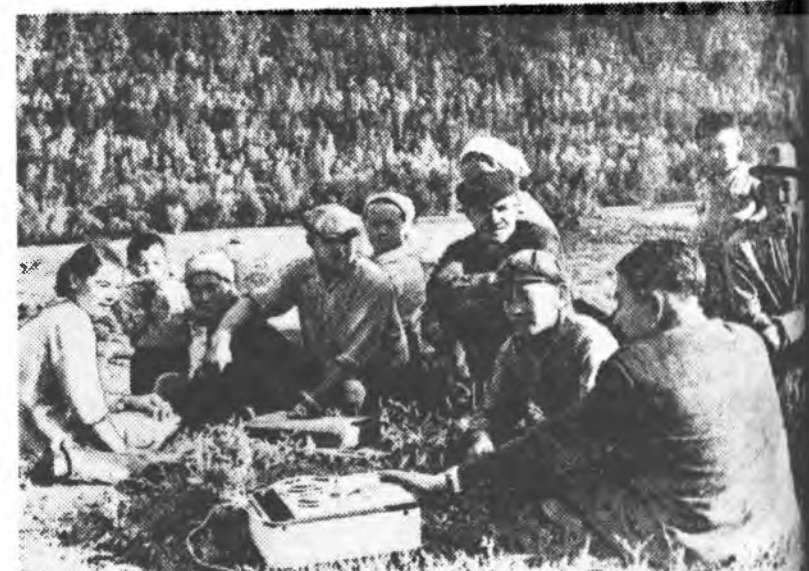
Захаамний аймагт XXII партсездын нэрэмжэтэ колхоз тариад болон механизаторууд энэ жэлдэ орооно таряан, курузын муу башэ ургасуула шадаан байна. Мүнөө эндэ урс хуряалгын худалдари түдэг дунда аюулагдаана.

Б АЛПША ОНДО совхозойхиднаа таряа хуряалгын үедэ минута, час бүхэнгэ гэмнэн, шэнэ ургасынгаа нэгэншэ хөөсөл, монсогорын ороон гээнгүй, богони болзоор абажа амбарраха, гурандө худалдаха гээн зорилго урдаа тайвхай.