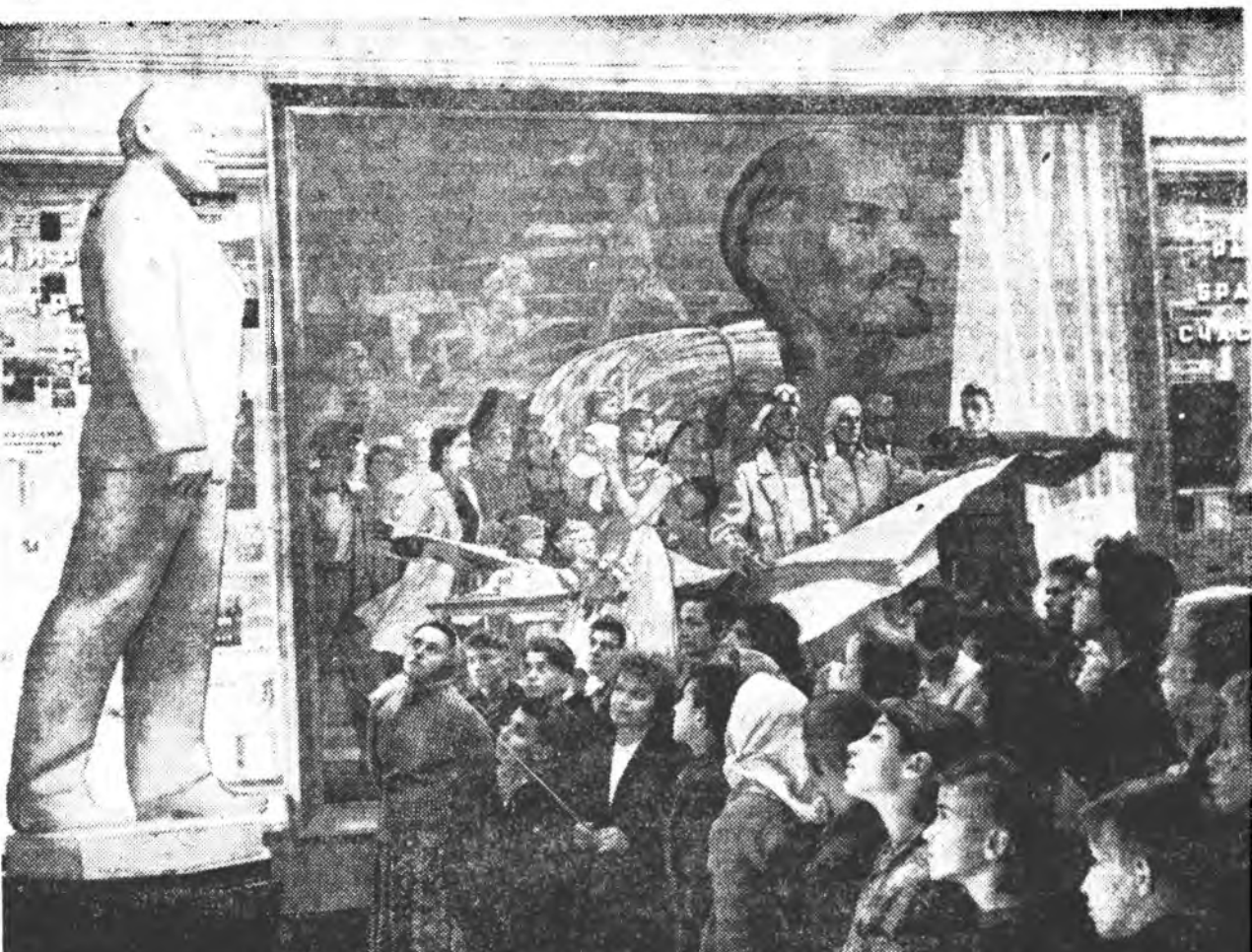
МОСКВА. В. И. Ленинэй Центральн музей 22-дох, түгэсхэлэй зал зарим тэды нэлбэгдэн шэнэхэдэглэһэн хуралсагай үзэгдэбэ. «Парти ба арад энэ үргэн далайсантайгар коммунизм байгуулгын үедэ» гэһэн төмэтэй материалнууд энде суглуудалданхай юм. Зураг дээрэ: музейн шэнэ зал соо.

сомолой органиацинуудай секре... ... Арба нэгэн жэлэй хургуулин нүүдье арбан жэлэй болгохо гэһэн парти, правительствын тогтоолой үндэһөөр хуралсагай, хүмүүжүүлгын хүдэмэриин шэнэхан хайжаруулаха эригтэе шэнэ жэлэй түрүүшүн үзэрһөө эдэбхитэйгээр дүүргэлтэ болгожо ахилаба. Бүхэ хургуулинүүдэй эмхидхэ хайнара хуралсагайгаа жэлэе залалта. Хургуулинүүдэй хүдэмэриин хянан шалгах, болото түнэлэмжэ үзүүлгын зорилгоор хуралсагай партинын комитетэй зүгһөө аймагай хүдэбэрлэгхэ 20 хүдэмэриингэй хайхан хууриин төсхөнүүдтэ гараба.