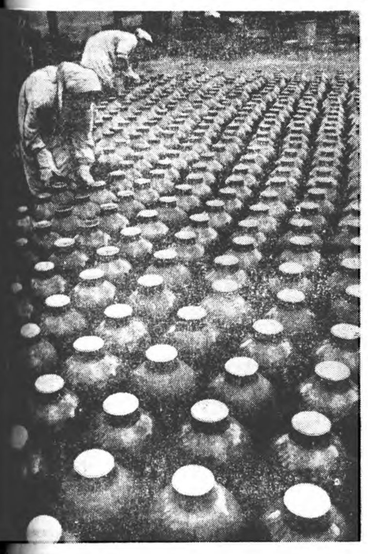
ЧЕЧЕНОИНГУШЫН АССР. Ассинска консервы заводой про...