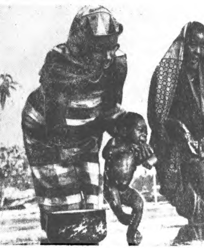
Мозамбикта — Африкадахи Португалин колонида Мозамбикые сүлөөлхэ фронтын сэрэгшэдэй болон колонизаторуудай солдадуудай хоорондо байдалаа болгожэ байдаг. Олонхонорд, үбгэд болон үбгэдэй Португалин солдадууднаа зугадан, хүриэ орон болгошо Танганьика тэжэе ошоно. Зураг дээрэ: Танганьикын газар дээрэ эрэгжэ орошод. Ута замда абажа эрхэлэнгээ хүлээр үхнүүдгээ угаажа байна.

Алжирай, мүн тэршэлэн капиталис бэе үхдэтэй хэмжээ юбууд бөөлүдэг ОАР-ай, Ганын, Малин, Гвинейн дүй дүршл түб дээрнэ анхаралтайгаар шудалан