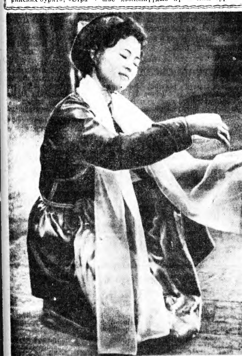
Улаан-Удын железнодоржон райондо уран найханай бүлгэмэй харгалга нахан үнгэрэгдөө. Эндэ Энгельсна Тотова «Бэлээршэ гэгэн хатар гүйсэдхэжэ, эрхим нээн сэлгэлтэ абба. Зураг дээрэ: Э. Тотова.

муудыг ойрын үдэр нүүдтэ Кабанскийн аймагта абашажа, наймаанда гаргахам гэжэ нүхэр Марин манда хонходоо. Ушар нимээһэ танай нутагай хүн зон мэмэ нигээд тала нүхэрэйгөө бэшигэн зохиолонд танилсаха байха гэжэ хүндэтэ нүхэр С. Савельев танда дуулганабди.