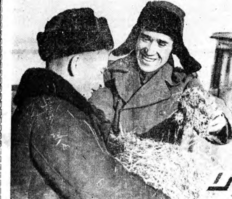
Торини совхозон малша, бухи худалчаринишад адууна малдаа эдбэ тэжээл бадхаа асуудалда ехэ анхараал хандуула.

гов суугараһаные цехай худалчаринишад танилуулаа. Гидролизон аргаар буйлуулдагдан һолоомоёо үнөөдтэ эдюулахын суугараһан үнөөдтэ һонирхожо хараба.