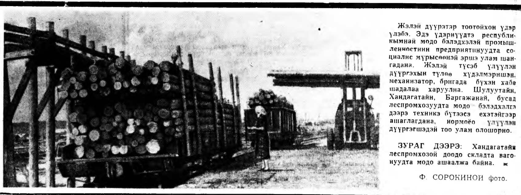
Жэлей дүүрэтэр тоотойхон үдэр үлбэ. Эдгээр үдэрүдэд республикыннай модо бэлдхэлэй промишленостин предриятинуудта социалне мурьсөөнэй эршэ улам шангада...