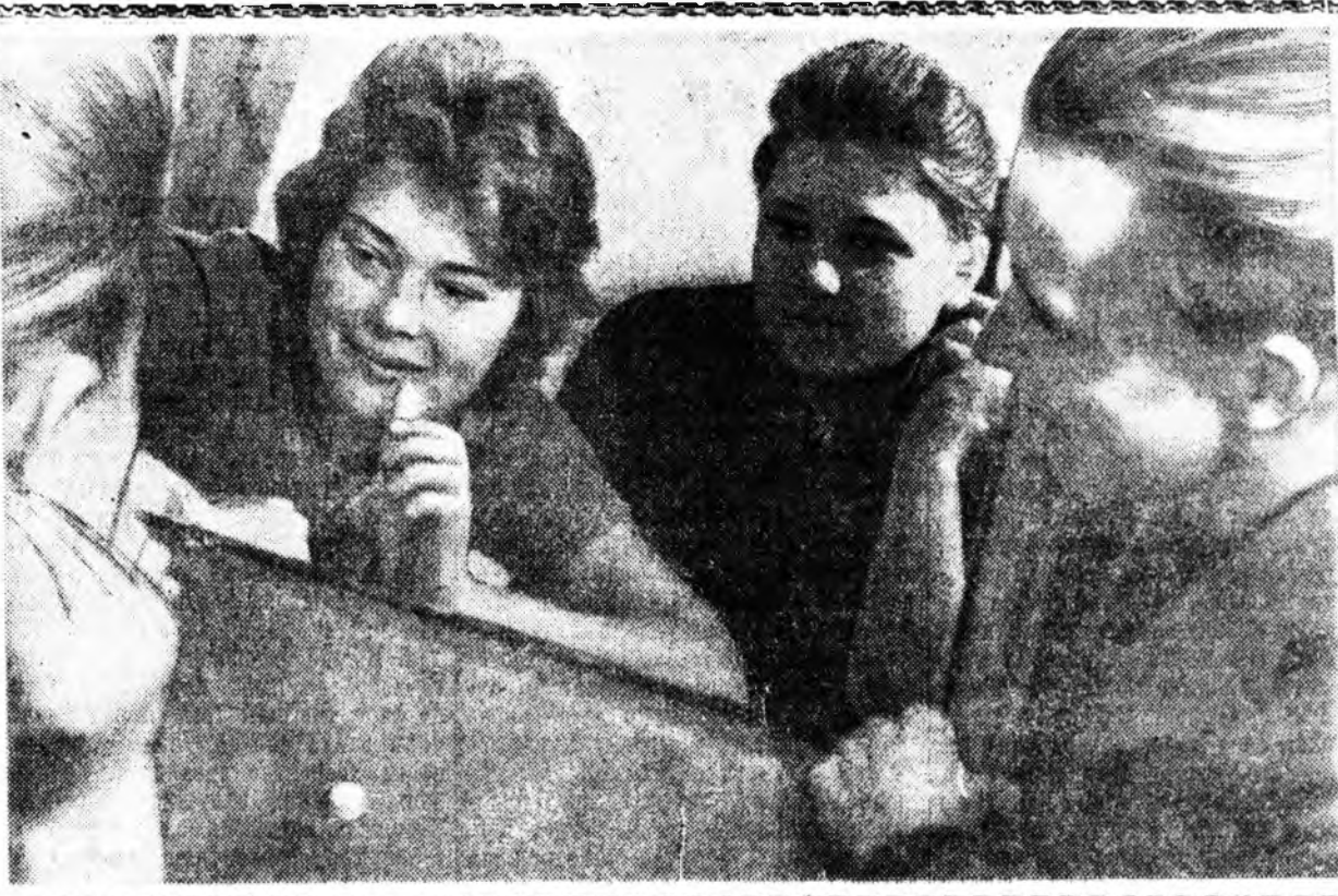
КЕМЕРОВСКОЕ ОБЛАСИЕ Ново-Кузнецк үйлдвэрийн управлени...