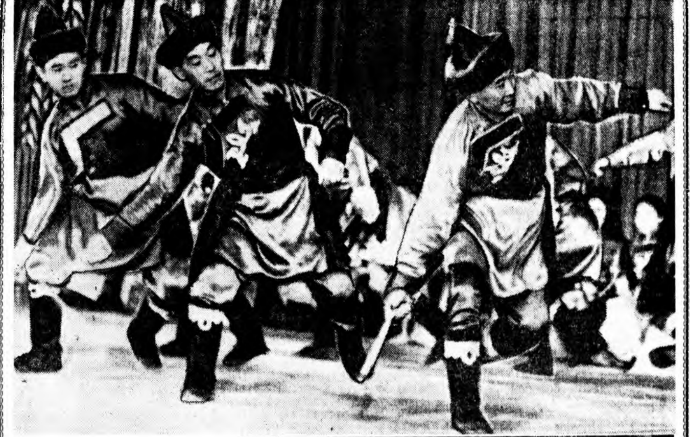
ЗУРАГУУД ДЭЭРЭ: (дээрхээ доош)...