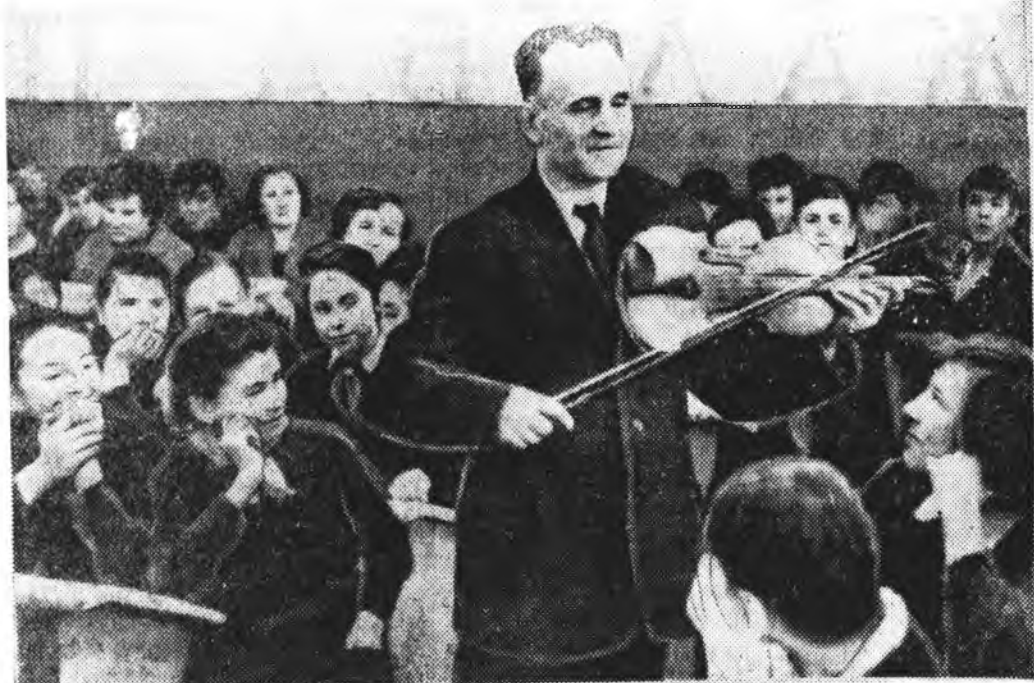
Хүгжэмдэ һураха, дурлаха гэзһэмнэй ондохон хэрэг ааб даа. Тэрэни хара баһаһа хойшо шулаха хэрэгтэй ха юм. Хүгжэмэй эрдэм ухае залуу үетэндэ нэбтэрүүлжэ талаар Буряадай АССР-эй артист Н. И. Маторин ехэһэн амал ябуулна. Энэ хүмнэй недели бүхэндэ Улаан-Удын 3-дахи һургуулида ошоно, хүгжэм тухай хөөрлөдөнүүдэ үнгарзон. Зураг дээрэ: Н. И. Маторин.