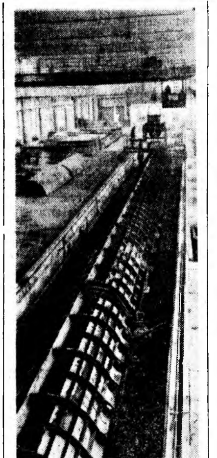
Ростов-на-Дону. «Ростовдон-водстрой» гидротехническэ тү-мэр бетоной завод аналгалга-да үгтөө. Тус предпринити зур-ган метр утатай, 800 милли-метр диаметртэй бетон лот-судыг бэлдэхэдэ гаргаха юм. Эдэнэ улаурууни системнүү-дыг түхэрэлтэдэ хэрэглэдэгдэ байна. Зурга дээрэ: түмэр бе-тон лотогудыг үйлдэрлэгдэ.

Манай отарын хо-онтоо эхэ хонин бүр-абажа түлжүүлжэ, килограмм 800 грам-шадха сонилалэ ял-Халхан үгэрэ хэрэг-луудын тусбэе үгш-лад асуулан, мэрэг-ваа гамингүй ажал-