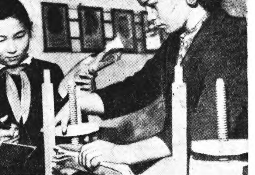
Кабинсын аймагт Сухай нотагтай 8 жэлэй хургуули. Энд хурагшадые ажалда дүршүүлж таглар эхэ ажал хэргэдэг. Багшанагай үүхээлээр хурагшад библиотекинээ худалдарида элэхитэйгээр тулална.

үхлүүд шагнадаг, элдэв янзын тахил мургал тэднийг хажуу хажуу байхын харахтай байх. Энэ үгээр харахад абжа, шүүжээд дэлгэрүүлэхэд, манай ажилшад ажил хэргүүдэд, өдөр, наукийн туйлтануудад хонирхуулж үхлүүд эргэдэг, ойлгосон, мэдсэнээр гүнзгий, ихэвчлэн хөөрөлдөж дэлгэрэх туртай, хонирхдог юм.