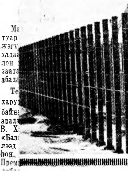
Ма-туар жэгү хэ-дэ-лон-заат-абал-те-хару-байн-ара-В. Х-«Баз-лээ-дон, Пре-

Комбинатай барилга дээрэ эр-шэн мэрэгжэлтэй олон хү-мэришад ажаллана; хабаргал-д, электрөгүрүшад, токарь-д, шугатуригүүд болон бү-