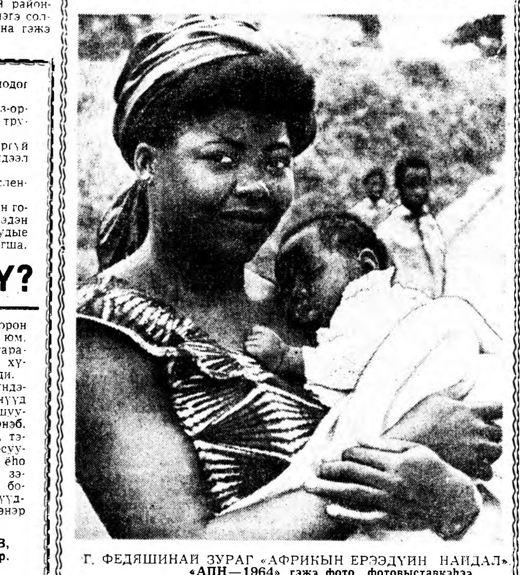
Г. ФЕДЯШИНАЙ ЗУРАГ «АФРИКЫН ЕРЭЭДҮЙН НАЙДАЛ» «АПН—1964» гэжэ фото фотоставкэһээ.

Тэдэниг түрмэ шорон худал шинхадаг юм. Бидэнэр түрэн гара-һан газартаа хон хү-нүүд болошонхойбди. Урда Африкын үндэ-һэн зоной эдэ үгэнүүд ямар үйдхартай гашуу-далтайгаар хэлэгдэнэ. Эдэнэ Фервурдын, тэ-дэнэй талын нохосуу-дай хархис мухай ёһо гуринис гэмнэһэн ээ-бүүрхэлэй үгэнүүд бо-лоно. Фервурдыг сүүд-лэхэ!— гэжэ эдэнэр урялана. Е. КОРШУНОВ, АПН-эй соборр. Лагос, Нигери.