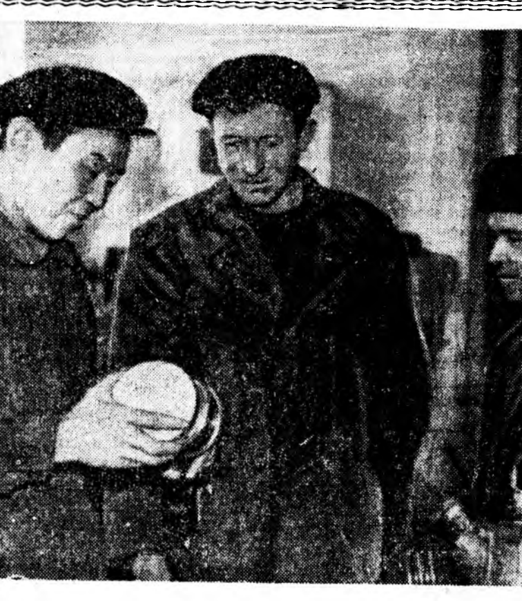
Ажаалай нэгэ үдэр... Забаврилга түлэг дундаа. Ямар өхэ хүдэлмэри хэгдэжэ байна гэшлэй! Удэртөөд нэгэ-хөр трактор капитальна забаврилгада орожо, бөдөл бөдөл. Шинэ жэлэй гарахын урда үшөөл нимэ хурданаар забаврилгадугүй юм. Шалтагаантайнь байгаа. Хэдэн трактор мастеркой сөө оруулалт задалжаруулаан, элдэб харгалсууд дутагдаха: склад сөө үгы юмнэ явахын. Тэдэ яахын аргагүй бөдөлгөөн механикаторнууд хүдэлмэри хаатуудга байн.

42-бохи жэлэе гарана.