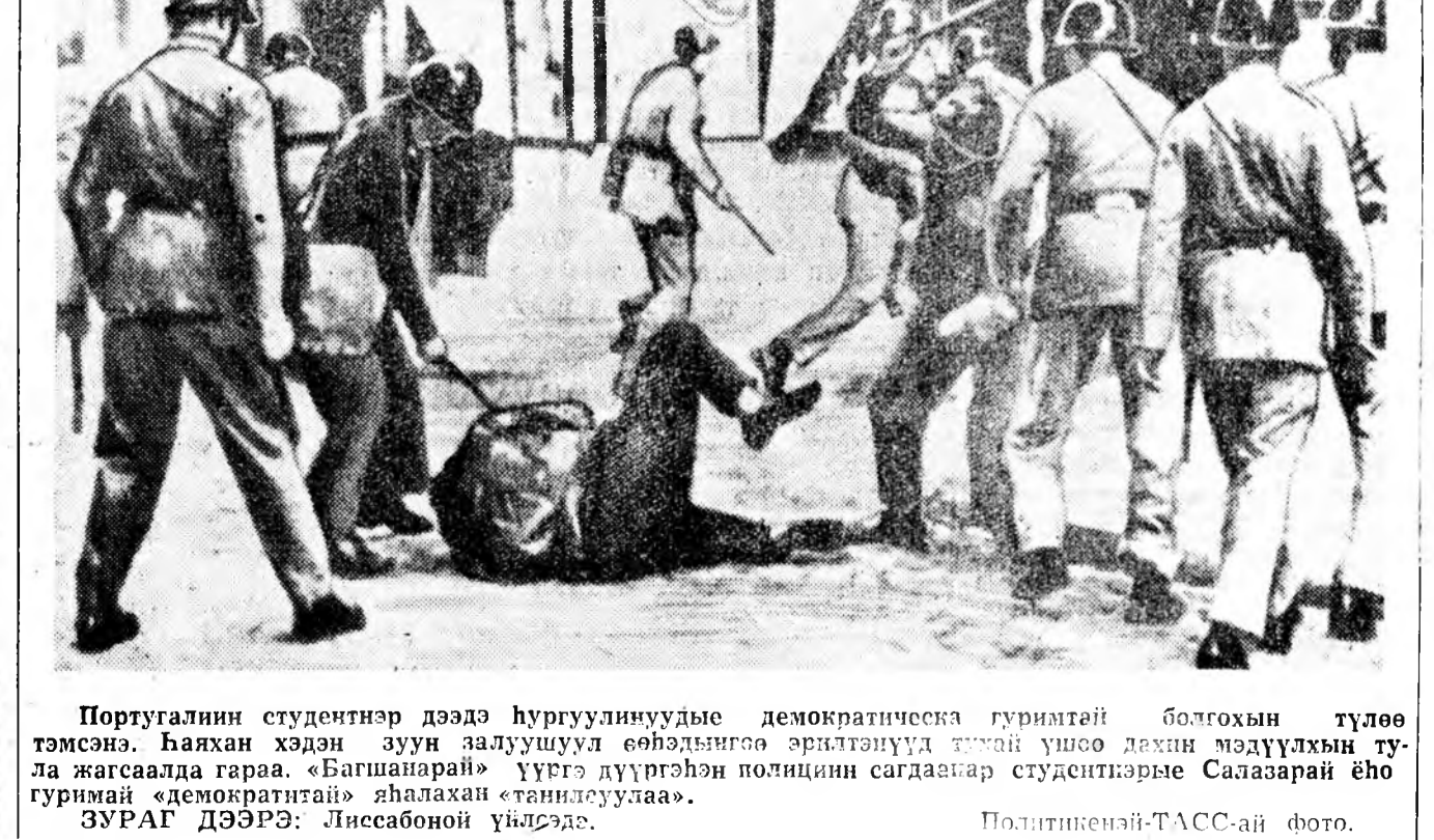
Португалин студентнэр дээдэ хургуулинуудыс демократиеска гуримтай болгохын түлөө тэмсэнэ. Баһхан хэдэн зуун залуушуул өөһэдынгөө эрилтүүд тухай үшөө дэхи мэдүүлхын ту- ла жагсаалад гараа. «Багшанарай» үүгэ дүүргэнэ полициин сагдааар студентнэрыс Салазарай ёһо гуримтай «демократи» аһалахал «танисуулаа». ЗУРАГ ДЭЭРЭ: Лиссабоний үйлэдэ.