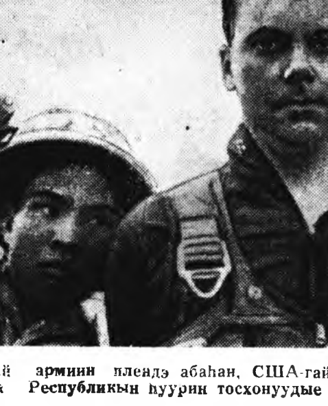
Урда-Вьетнамай Сүлөөрэггын арминд нэгэ отрядтай командир намда нэгэ нимэ түүхэ тухай хөөржэ үгэсэ. Нээрэминэй бу дурдаты гэжэ гуйгаа бэлэй.