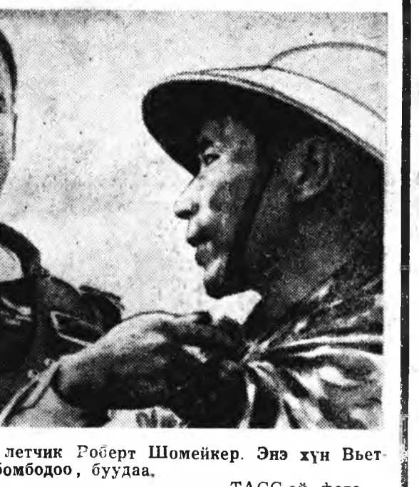
Урда-Вьетнамай Сүлөөрэггын арминд нэгэ отрядтай командир намда нэгэ нимэ түүхэ тухай хөөржэ үгэсэ. Нээрэминэй бу дурдаты гэжэ гуйгаа бэлэй.