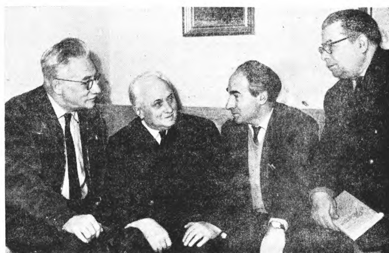
Театр, жүжэг харашад