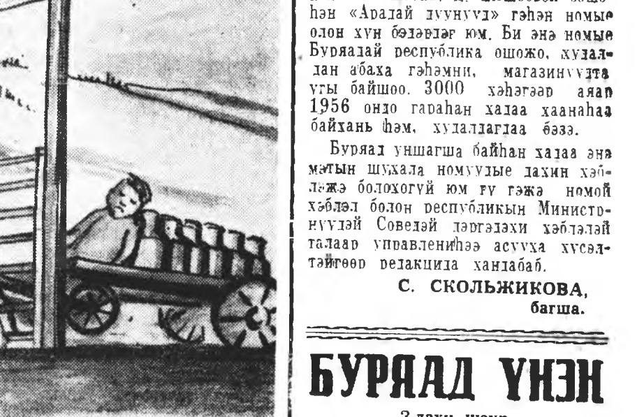
Буряад үнэн - 3-даху ноур. 1965 оной-мартын 11.