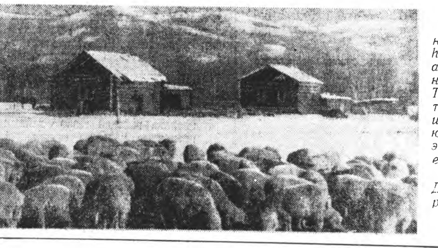
Ш О Г