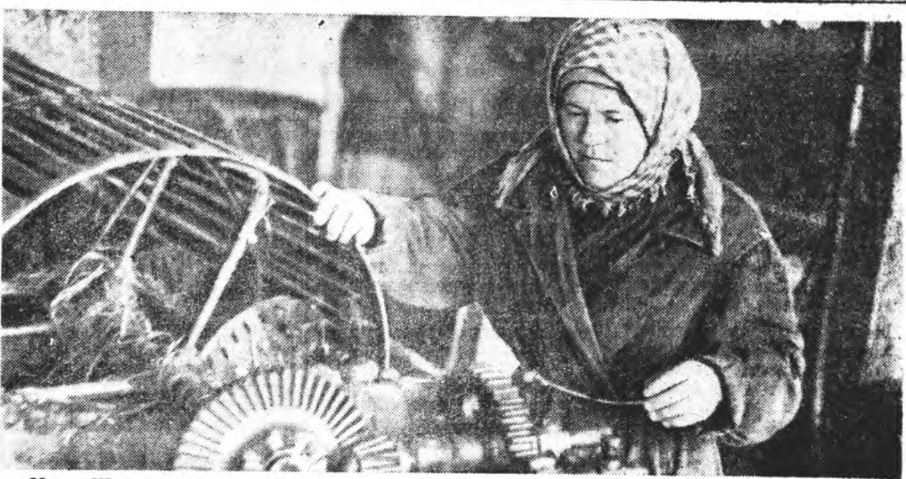
Мухар-Шабэрэй аймаг «Коммунизм» колхозой гашүүд Мухар-Шабэрэй сельсоветэ депутат...