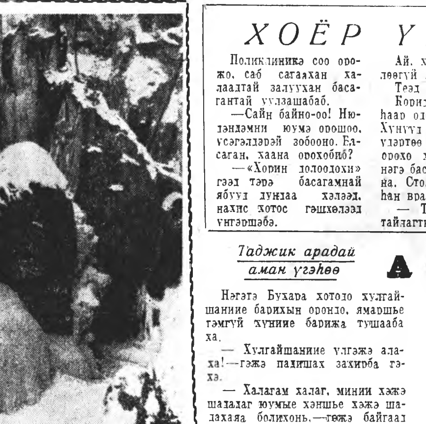
Мундартга Слаянуудай хоорондуур

САЙГАН УВГЭНЭЙ ЗӨХӨГӨӨД ДУУЛААН ДУУНУДАЙ НЭГЭН ИИМЭ Сайн гэжэ унаган Ташаа сагаан борохон.