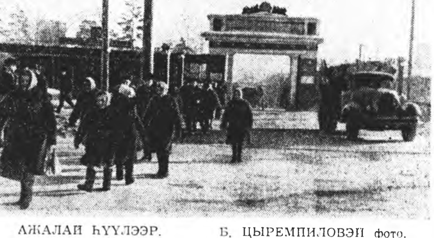
АЖАЛАН БҮҮЛЭЭР.

Саян Сандаков 1886 ондо Хорин аймагай Хуурай нютага үгытай малшанай бүлэдэ түр- һэн. Хара баганаа хойшо ажал худамрн хэжэ эхилээ.