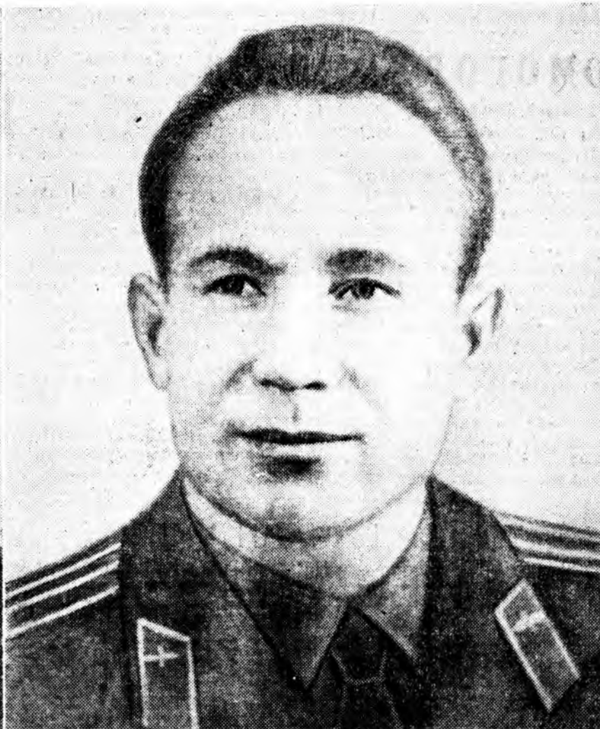
Подполковник ЛЕОНОВ Алексей Архипович «Восход-2» онгосын 2-дох пилот, лётчик-космонавт