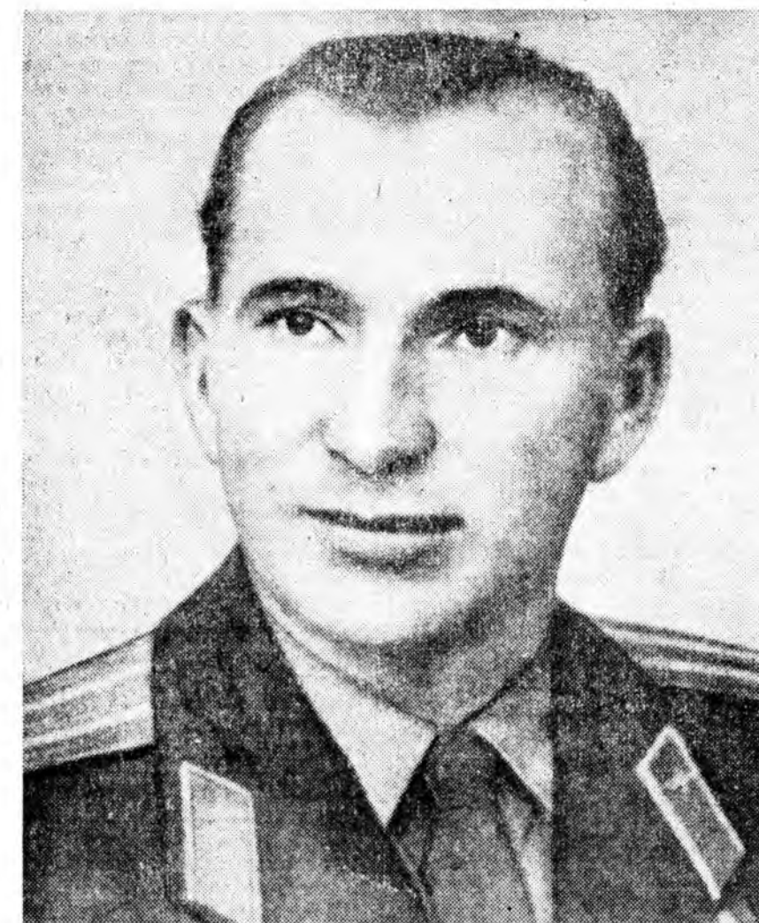
Полковник БЕЛЯЕВ Павел Иванович «Восход-2» онгосын командир, лётчик-космонавт.