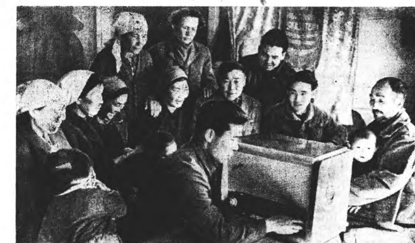
— Ажалынгаа забхарта сугларжа, бүхы орон соонийн, хилын саана ямар онин болжог байна, мун партийна ЦК-гай Пленум тухай мэдээлэлүүдэ радиогоор шагнахадаа, сэдхэл сээжэ уужам боложо, худалдөөришадэй бүтэсэтэй болоходол гээшэ, — гээд Захаамин аймагай «Коммунизмын зам» колхозой хаалин фермынхид хөөрлэдэ. Энэ фермынхид гурэндэ ху хааха кварталынгаа түсөө болзороон урид, мартын эхээр дүүргэнэ байна. Мүнөө түсөөбөө гадуур ху эхээр хаан түлөө мүрхөө улам эршэтэйгээр дэлгэрүүлхэ. ЗУРАГ ДЭЭРЭ: энэхон хаалин, малшад улаан булан соогоо радио шагнаха байна.