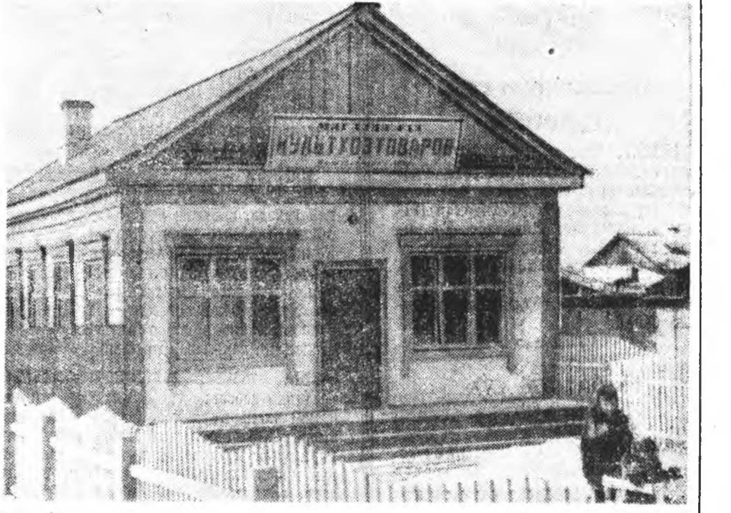
Ажаһуудалай талаар хүн зоние хангаха асуудал шухалын шу-хала гэжэ хэндэше мэдээжэ. Ажаһуудалай хайн байгаа наа, ажал хэрэгшье урагшатай, хүн зоние хуужоон байха ха юм. Тинмээшэ Байгалай леспромхоз энэнидэ эхэнэр анхрал хандуулна. Хайхан эндэ гоё гэгшын ордон бод-хогдобо. Энэниин юун гэшэб гэе наа, культу-магэни болон гэшэл. Эндэхид гэр бүлэдэ шу-хала хэрэгсэлүүдые энэнидэ худалдажа аба-ха аргатай болоо.

са эмнэгшээр ажалла хизаарладаггүй мүн эхидхэл, хөөрөлдөөнүүдые мал-шадан дунда үнгэрэгдэг, элдэ янзын ам дом, гингенин хэрэгжүүлүүдые наймаалаг. «Врачта гэжэ ариуутэ амбулатори ошохоёо болижо амар-шообди, энэ үбэлжэлгын сүлөөгүй үдэ гадаргэ харангүй худалдэби». —гэжэ тэндэхи малшад хэлсэдэг болоно. Гадна аймагтайн поликлиника орой болотор худалдэг, маандые амарыше ошор ээлжээгүйгөөр үздэг болонхой. Ж. ЦЫРЕНОВ.