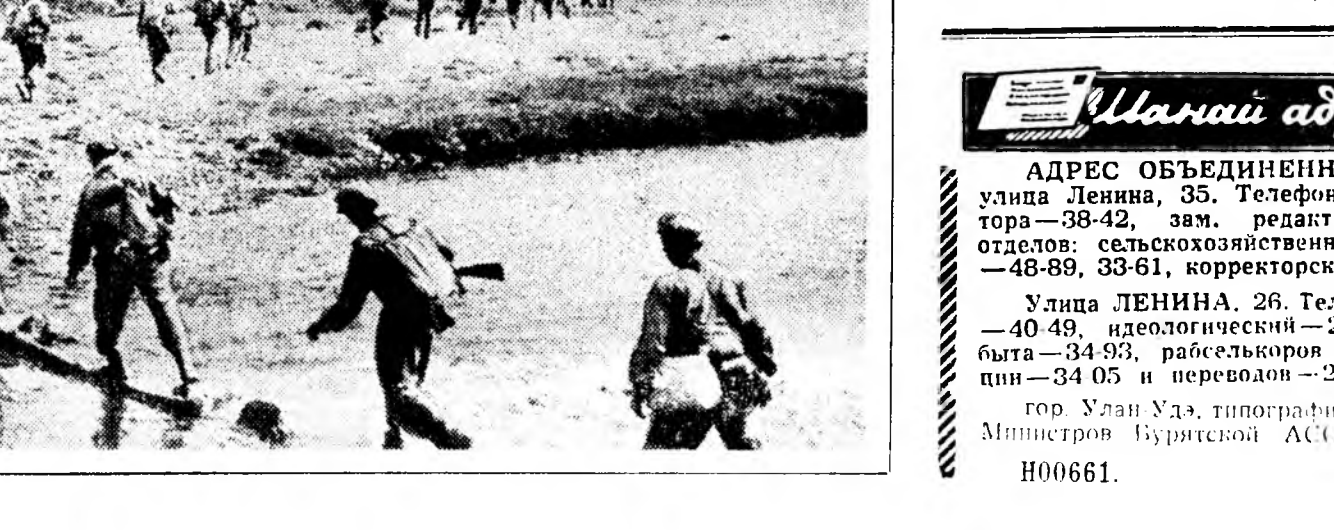
Лаос, США-гай авиаци Патет Лаогой болон зүүнэй тала барндаг хүсэвүүдэй хиналта дорой байдаг газар дээрүур харата муухай зорилгоор ниндэлгэнүүдые хэнэ.