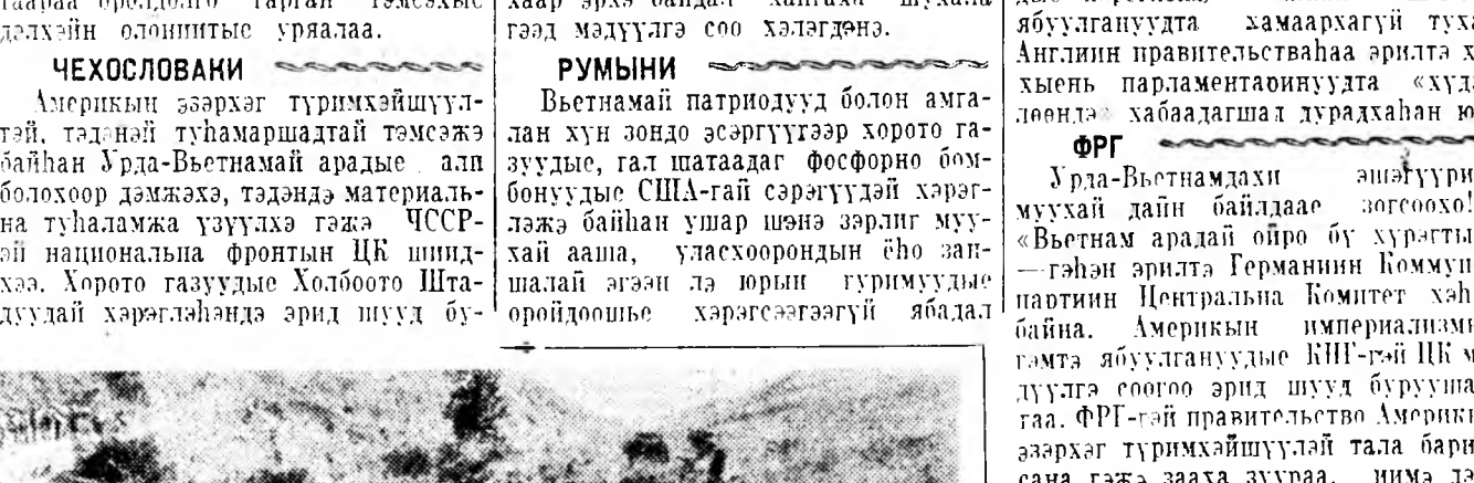
Лаос, США-гай авиаци Патет Лаогой болон зүүнэй тала барндаг хүсэвүүдэй хиналта дорой байдаг газар дээрүур харата муухай зорилгоор ниндэлгэнүүдые хэнэ.

Урда-Вьетнамадхи эшгүүритэ муухай дэйн байлдаа зогсоохой! «Вьетнам арай ойро бу урстай!» — гэһэн эрилтэ Германиин Коммунист партиин Центральна Комитет хэһэн хэһэн байна.