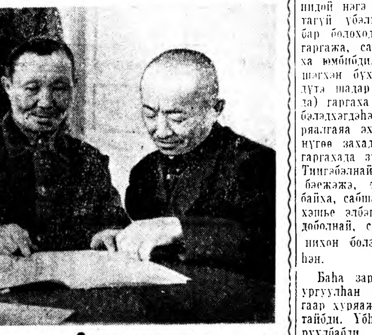
УТЫН ТУГНЬЕ УРУУДАН БЭДЭРЭ: УГЫ!

Энэ элдин талыс Мухар-Шэбэрэй аймагай хэдэн ажахынуд: Суулгын сохоз, Шаралдайн, Заганай, мун Барай хоёр колхозууд эдэжэ, таряа таридат, үбэ ногоо ургуулхэ сабшалан барилдаг гэшинэ. Зариманайн мал мунөөшье эндэ бэлнээр ондо ороо. Хаарай энэ үнэтэ унан ханганыг хэр зэргээр хэрэгжэжэ эдэ андхид тухсаржа байгаа юм ааб гэжэ анхаралтад юм. Үнөөхи «тедэ» гэмнэмнай эндэбхэ эхитэй. Суулгын «Заготернишөө» эхилдэ, Тугнын хүүрээ хүртэр эсэхэдэ, машина, мотоциклын яахэнь хэсүү: наранда шаргажа, нобилан сабанай унанай урсгал машина «Хумар-Шэбэрэй». Тедэ энэ хайрманы, үгы найрам бэшэ, харин урдажа байн энэ урсгал уныс барилжа, сабшалан, поли дээрүүрээ гаргажа байгаагүйдэн хара буунаар.