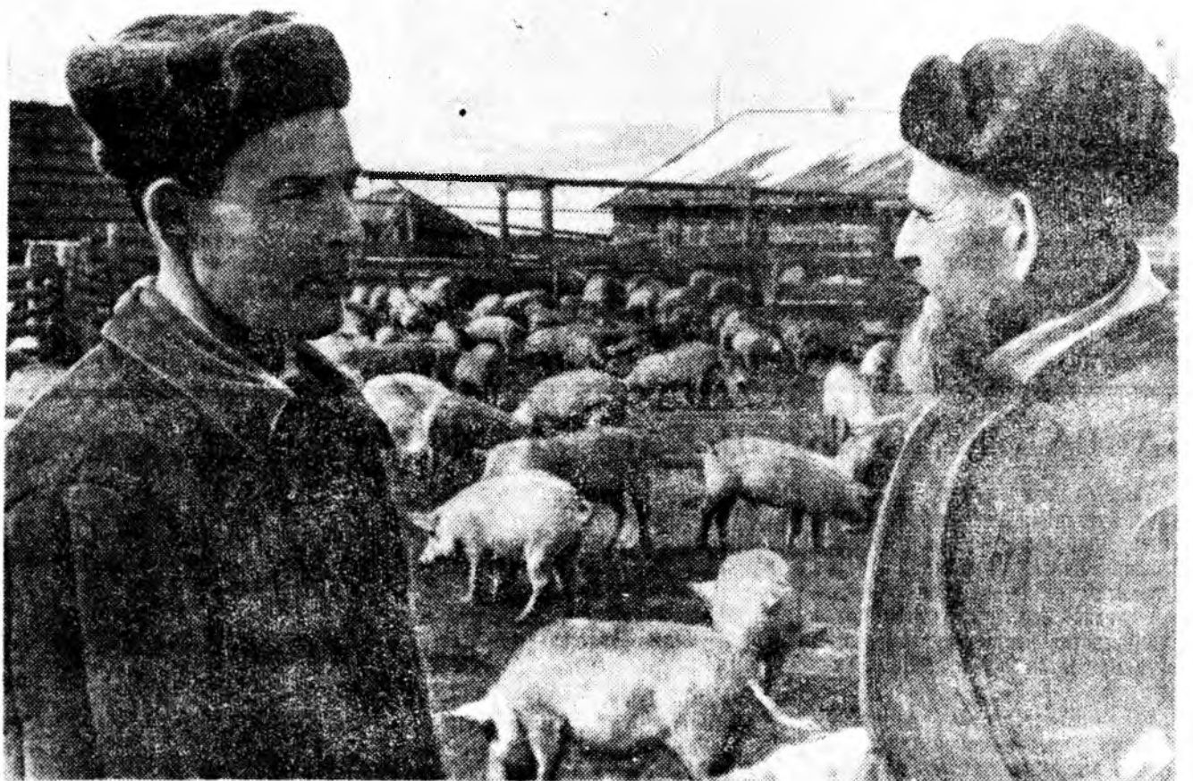
Улаан-Удны аймаг «Искра» колхозой гахайн ферм дээр гахайн шаван таргалуудад цех бий юм. Хүндэ хүшэр ажлын эхэндээ энэ оньхожуулагданхай. Гахай тэжээлдээ үбэнэй гурил элбэгээр хэрэглэгдэдэг. Унгэрэн жэл эндэхн гахайнд хямда сэнгэй 120 центнер гахайн маха гүрэндэ тушаанан.