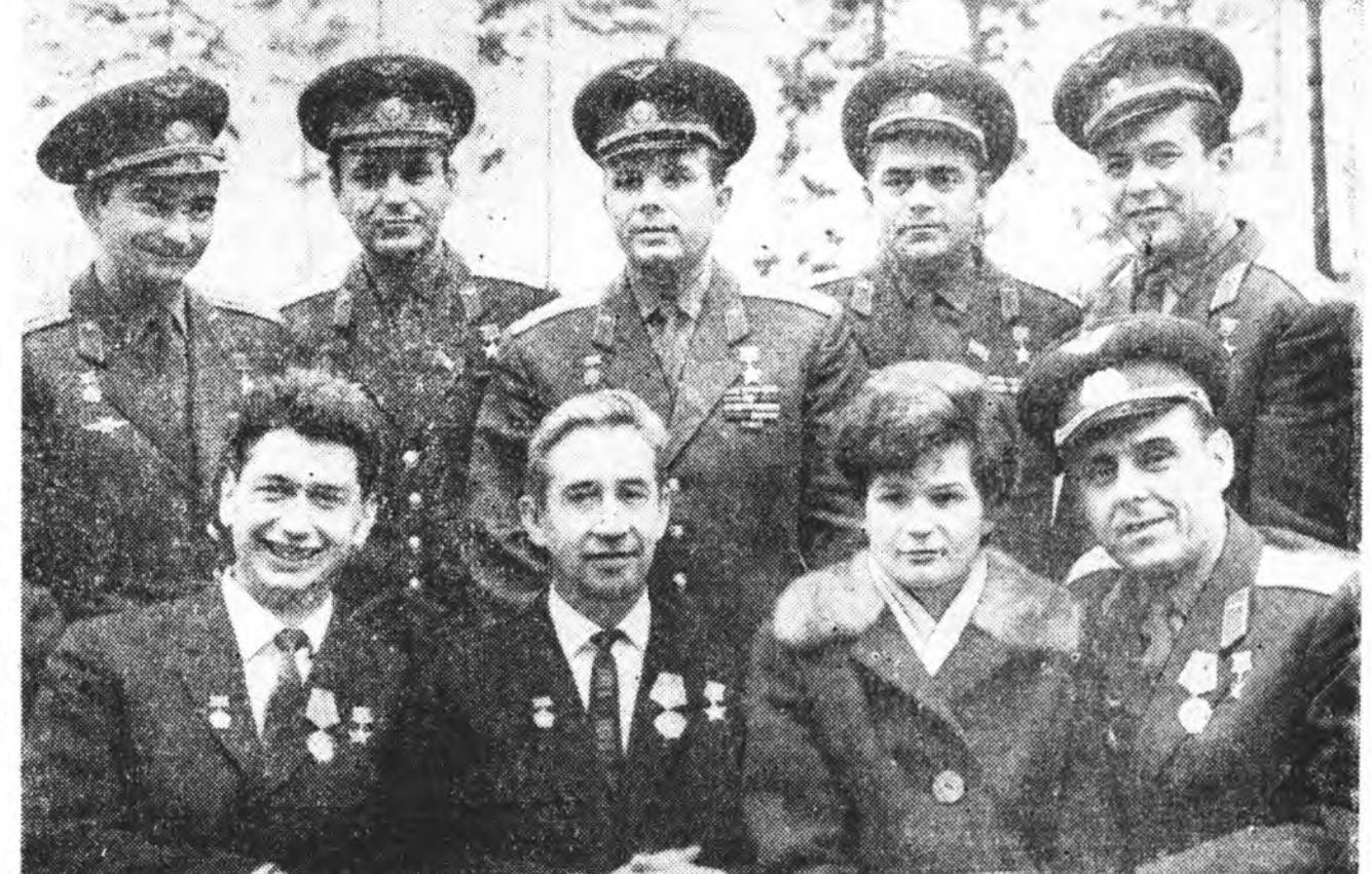
ЗУРАГ ДЭЭРЭ: (зүүн гарһаа, түүрүүшн зэргэдэ) Б. Б. Еворов, К. П. Феоктистов, В. В. Николаева-Терешкова, В. М. Комаров, (хойрдохи зэргэдэ) В. Ф. Быковский, Г. С. Титов, Ю. А. Гагарин, А. Г. Николаев, П. Р. Попович.