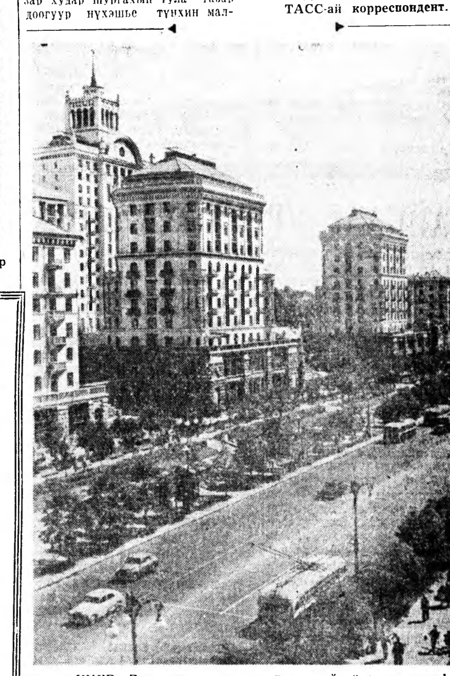
КНБВ. Эсэгэ ороноо хамгаалтын дайнай үедэ эхэ хандаралда оройн хотын гол үйлсэ — Крепцатн түрүүшынхнээ дутуугүй гоё байхан болохой.

III группын инвалидуудтай табанай дүрбэн хуби мүнөө Россия Федерацин арадай ажахыда ажаллажа байдаг. Шөнэ хуулин хүсэндэ оруулагдахад, тэдэнэрэй пенсин хэмжээн хоёр дахин эхэ болгогдохо. Тухайхад, тэдэнэр нэгэ жэлэй турша дотор